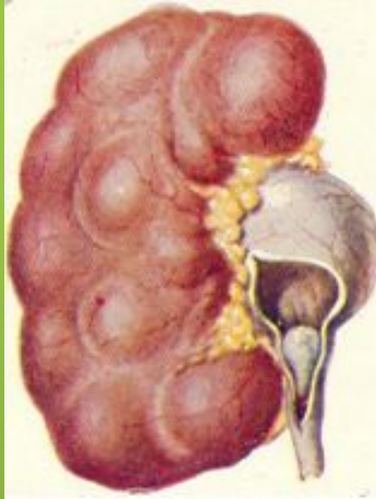
Почка при гидронефрозе

Гидронефроз — заболевание почки, связи с нарушением оттока мочи и ухудшением основных функций почки.