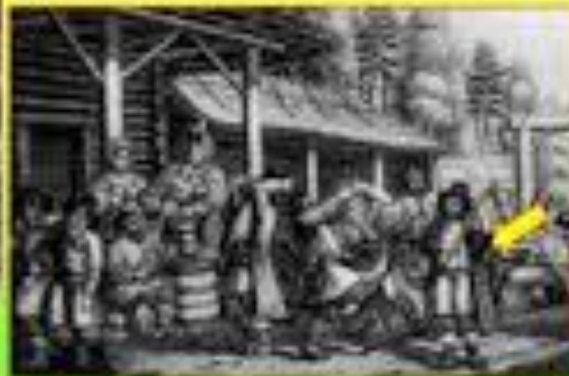
Сцены из русского народного быта начала 19 века