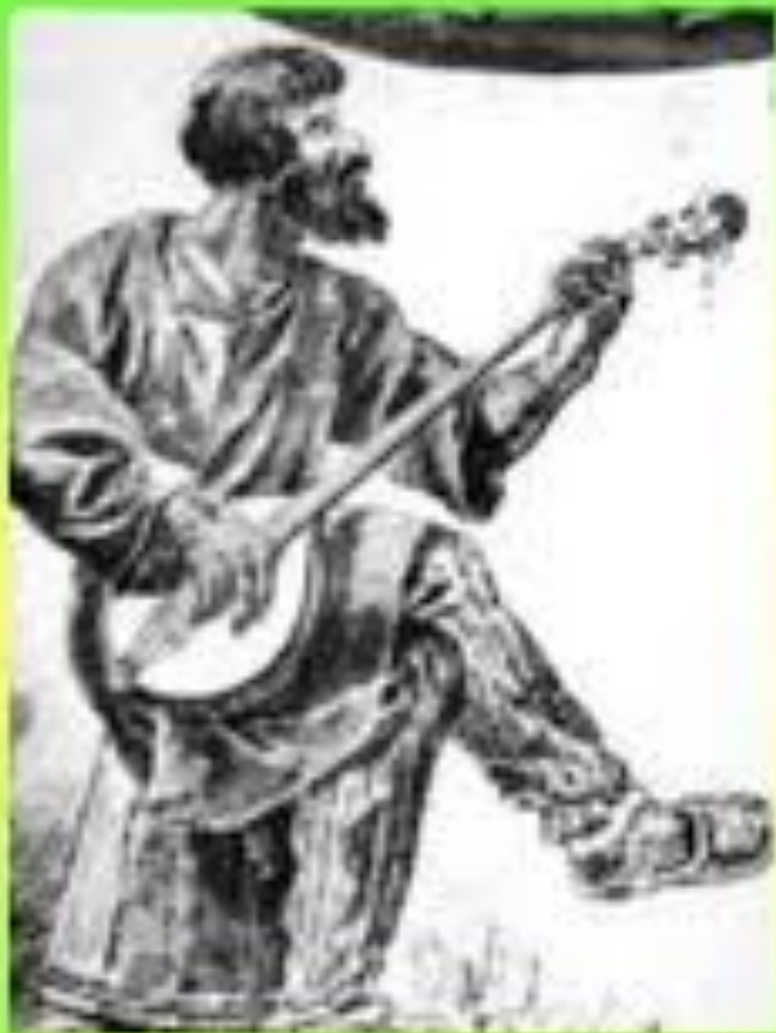
Народный исполнитель с балалайкой, имевшей круглый кузов. Начало 19 в.