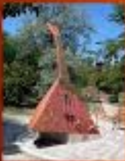
Скульптура балалыки Вяткина в Ульяновске