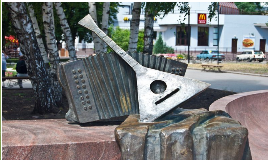
памятник Митрофану Пятницкому