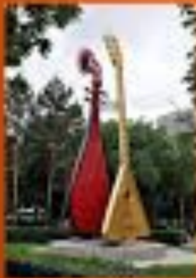
Скульптуры балалыки в скверике около "Луга" в Рязани