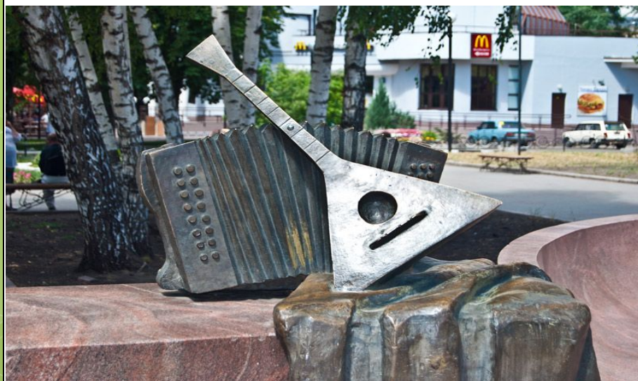
памятник Митрофану Пятницкому