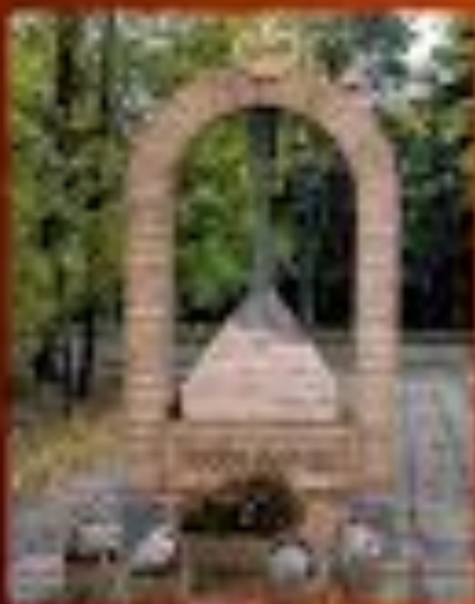
Скульптура балалыки Вяткина в Ульяновске