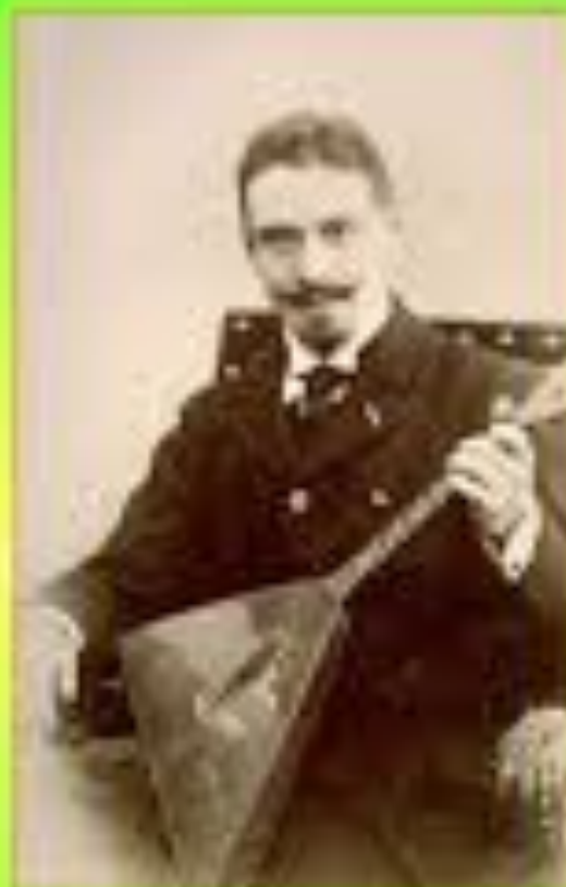
Василий Васильевич Андреев 1861-1910