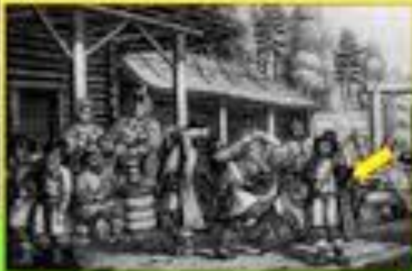
Сцены из русского народного быта начала 19 века