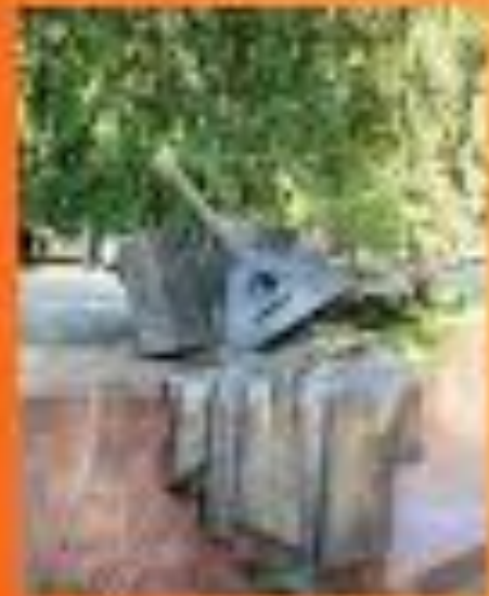
Скульптура балалыки в скверике в Дельфинарии