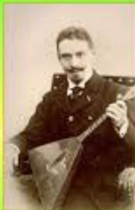
Василий Васильевич Андреев 1861-1910