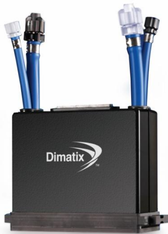
Печатающая головка Fuji Dimatix SG1024 StarFire 10 pl