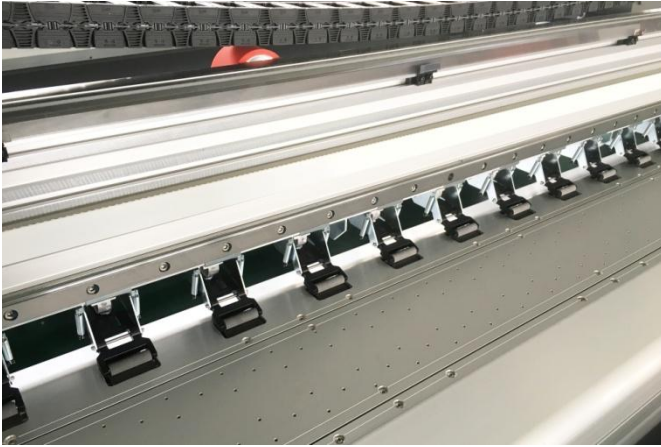
Вакуумный стол и прижимные ролики