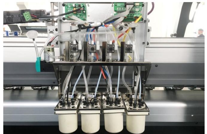
Система подачи чернил