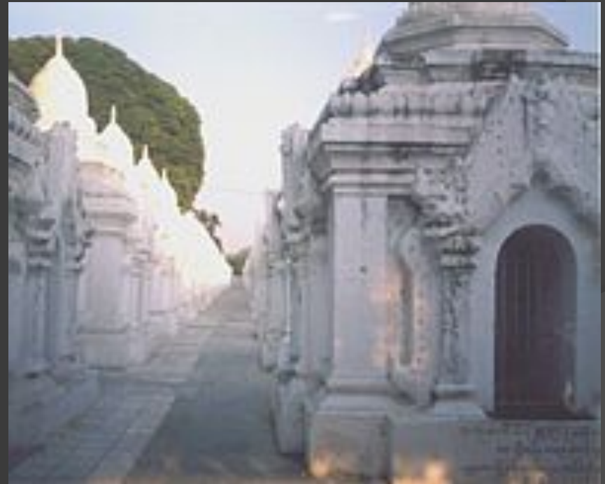
Высеченная на мраморе Типитака в Куто-до Пайя