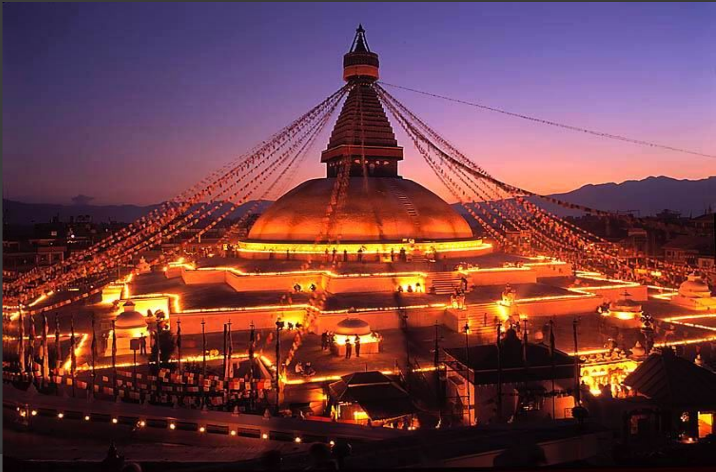
Знаменитая ступа Будднатх