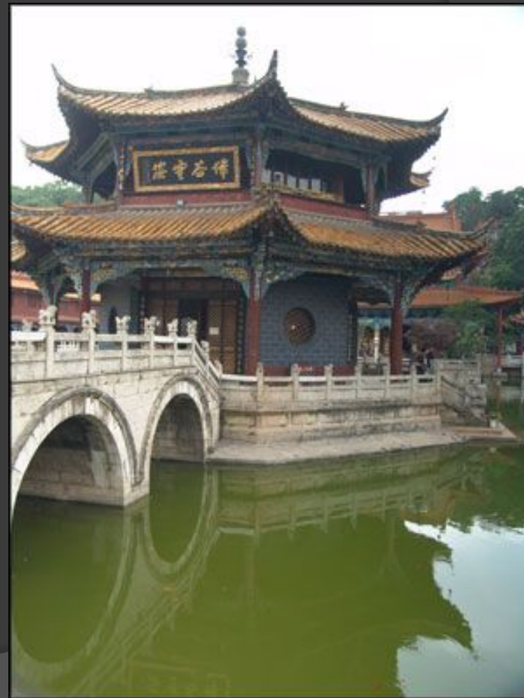
Буддийский монастырь в Куньмине