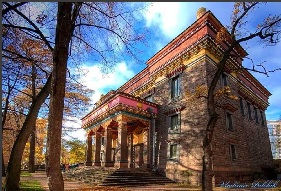
храм-молельня в С.Петербурге.