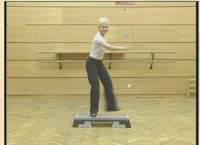
Упражнения для координации.