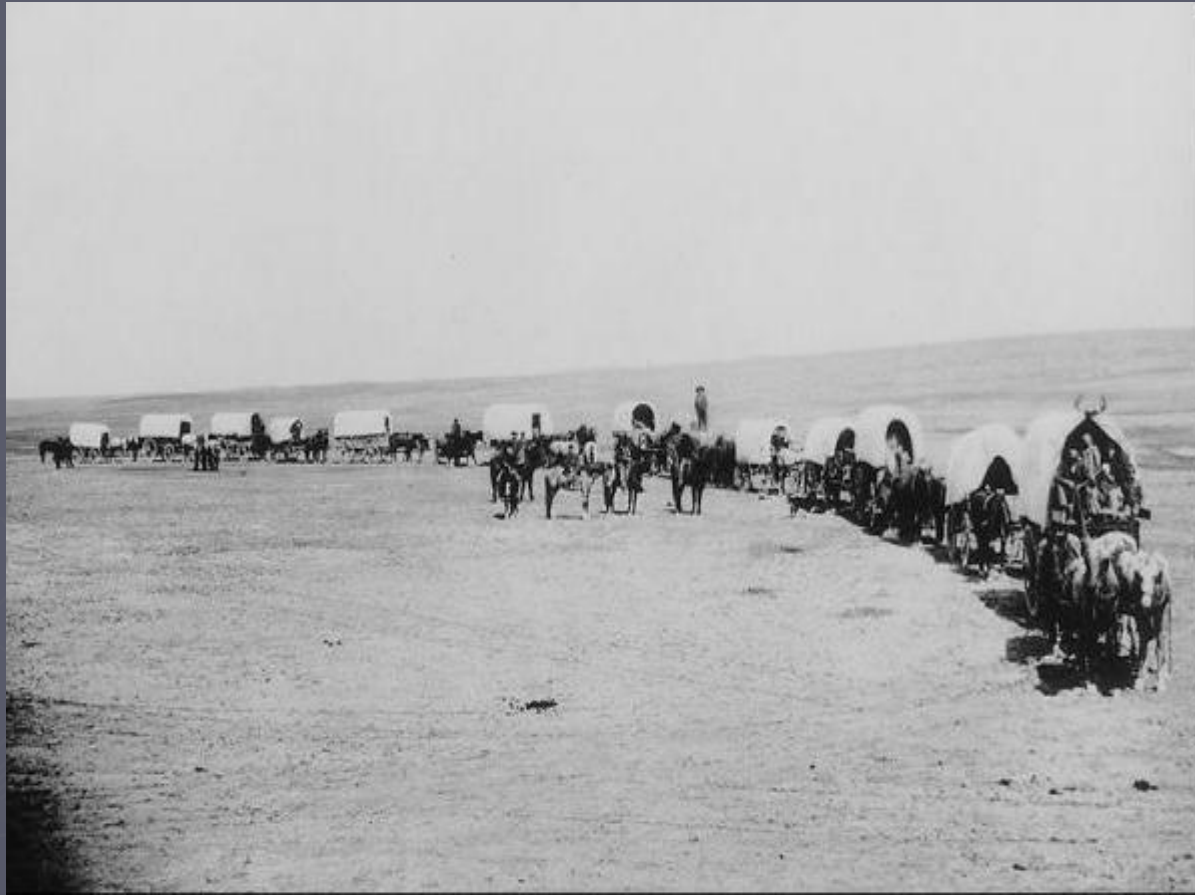
Переселенцы на Запад