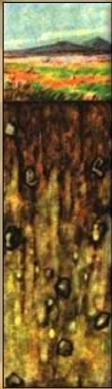
Серая лесная почва