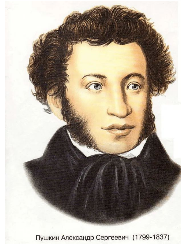
Пушкин Александр Сергеевич (1799-1837)