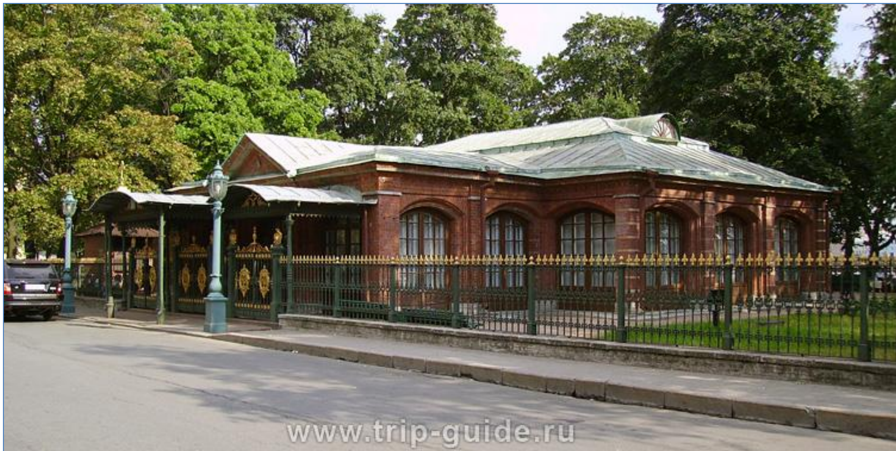
Домик Петра I