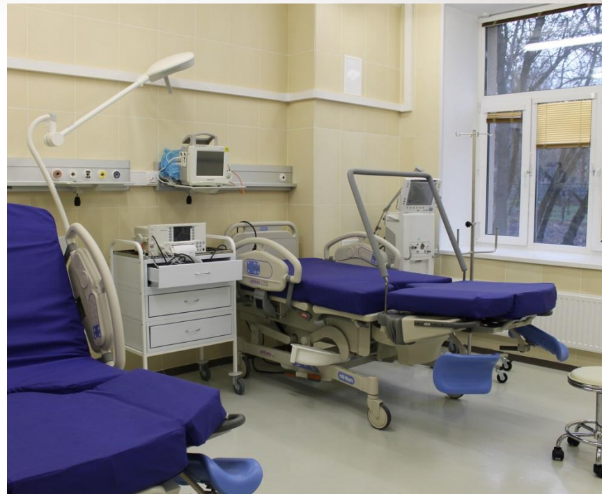
Родильный блок (вверху) предполагает различные методы родов – хоть в присутствии мужа.

Ребенок с самого рождения находится с мамой! В послеродовом отделении создают условия для комфортного пребывания матери и ребенка, детки лежат рядом с мамочками. Все необходимые процедуры маленьким (вакцинация, заборы крови, осмотры) делают в палате, не увозят их в другие отделения.