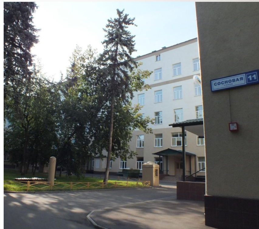
Это живописное место. Рядом Покровско-Стрешневский парк и Строгинская пойма. Много зелени, свежо и тихо!

Кстати, персонал в обновленный роддом отбирают по конкурсу. Это уже показатель!