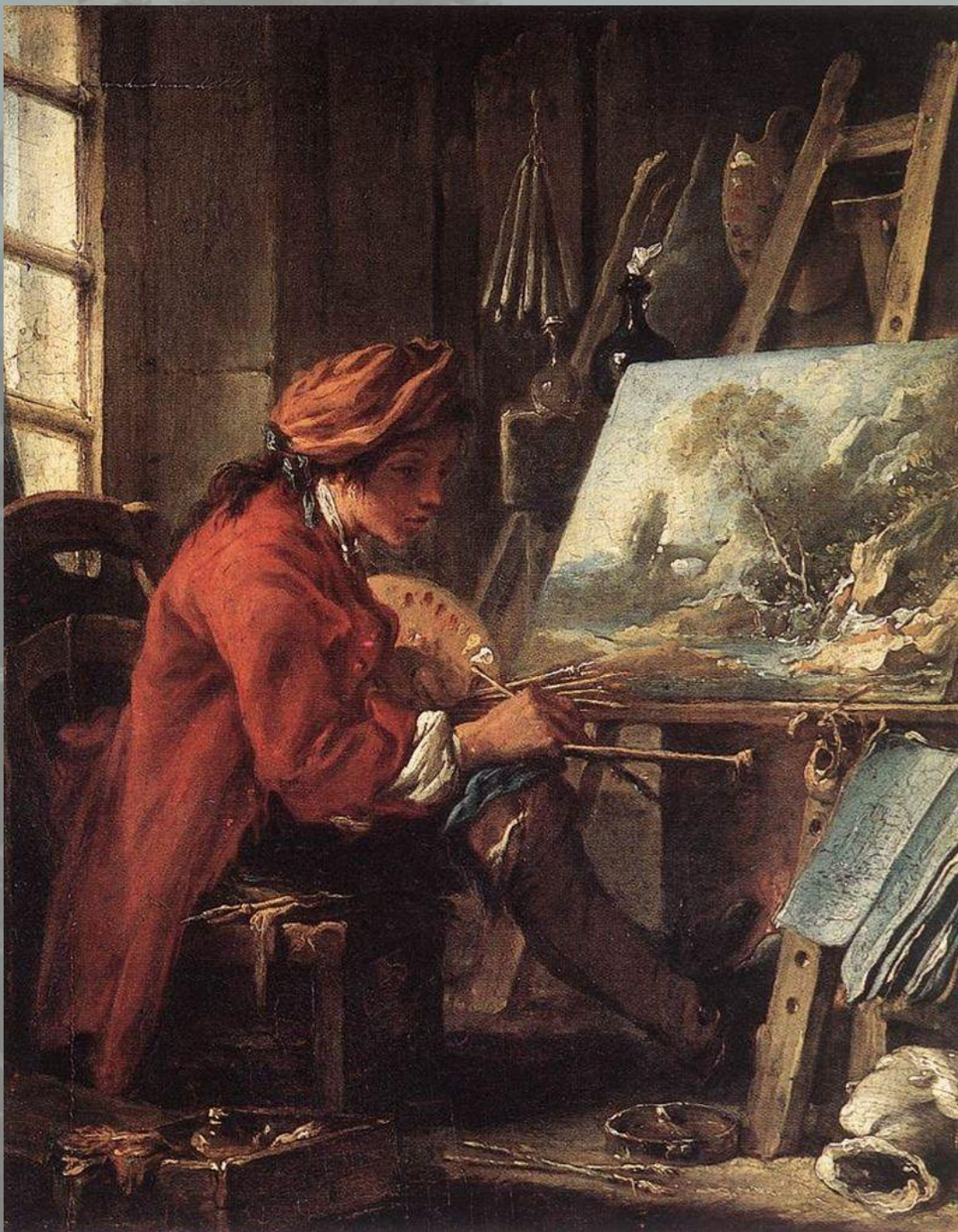
«Автопортрет в мастерской» 1720г.