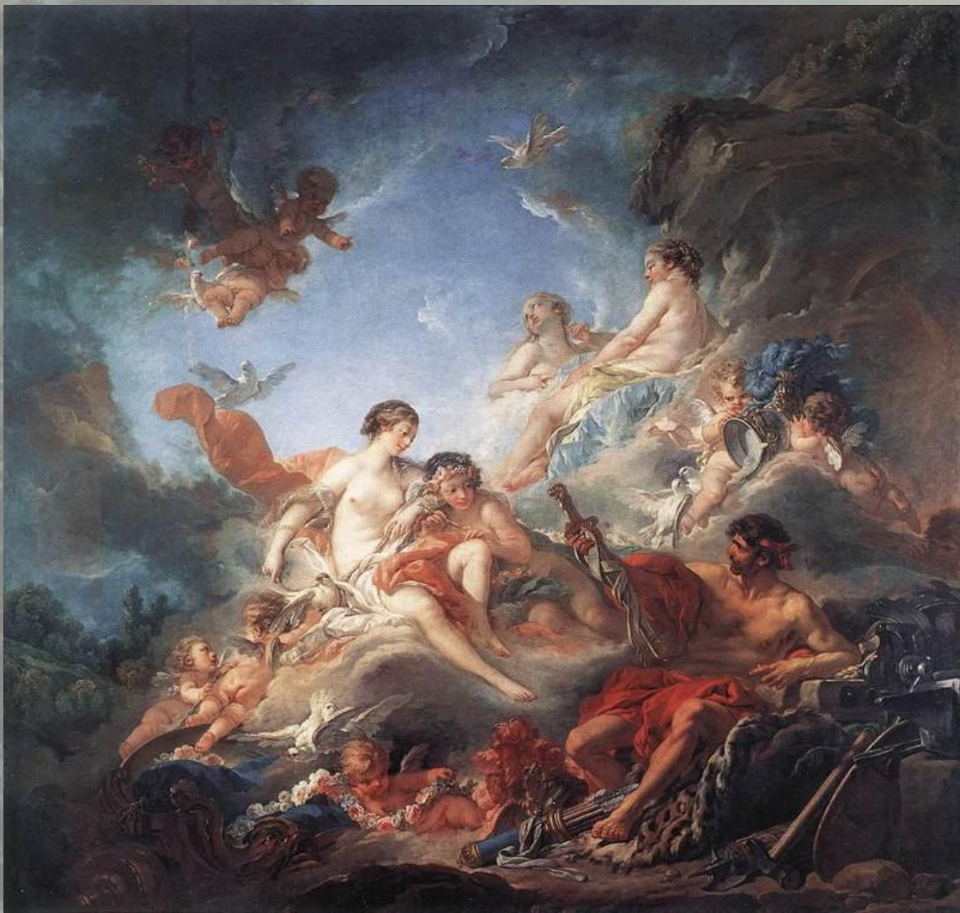
«Вулкан вручает Венере доспехи Энея»