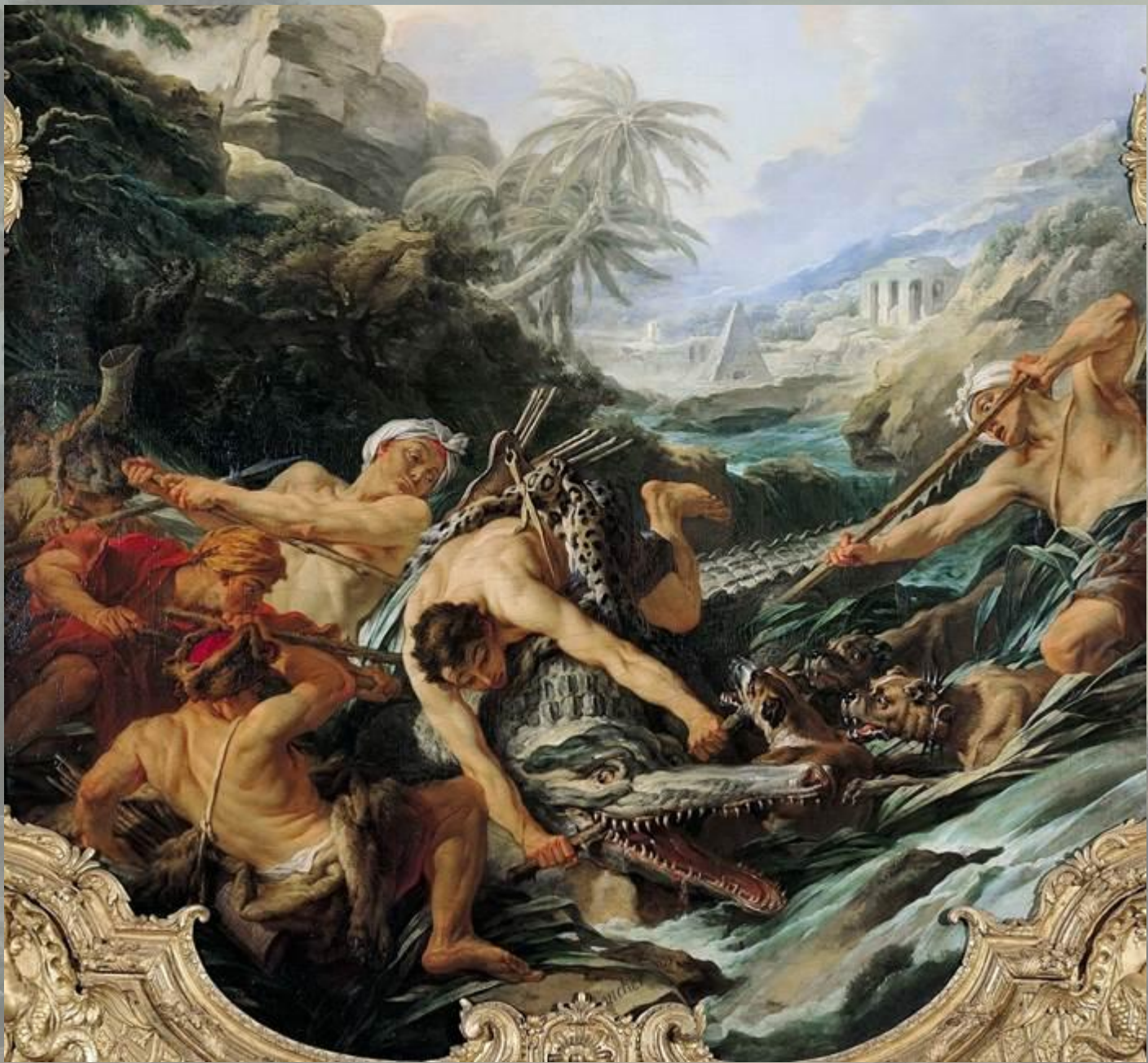
«Охота на крокодила»