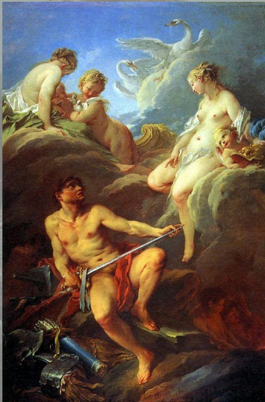
«Венера, просящая у Вулкана оружие для Энея»