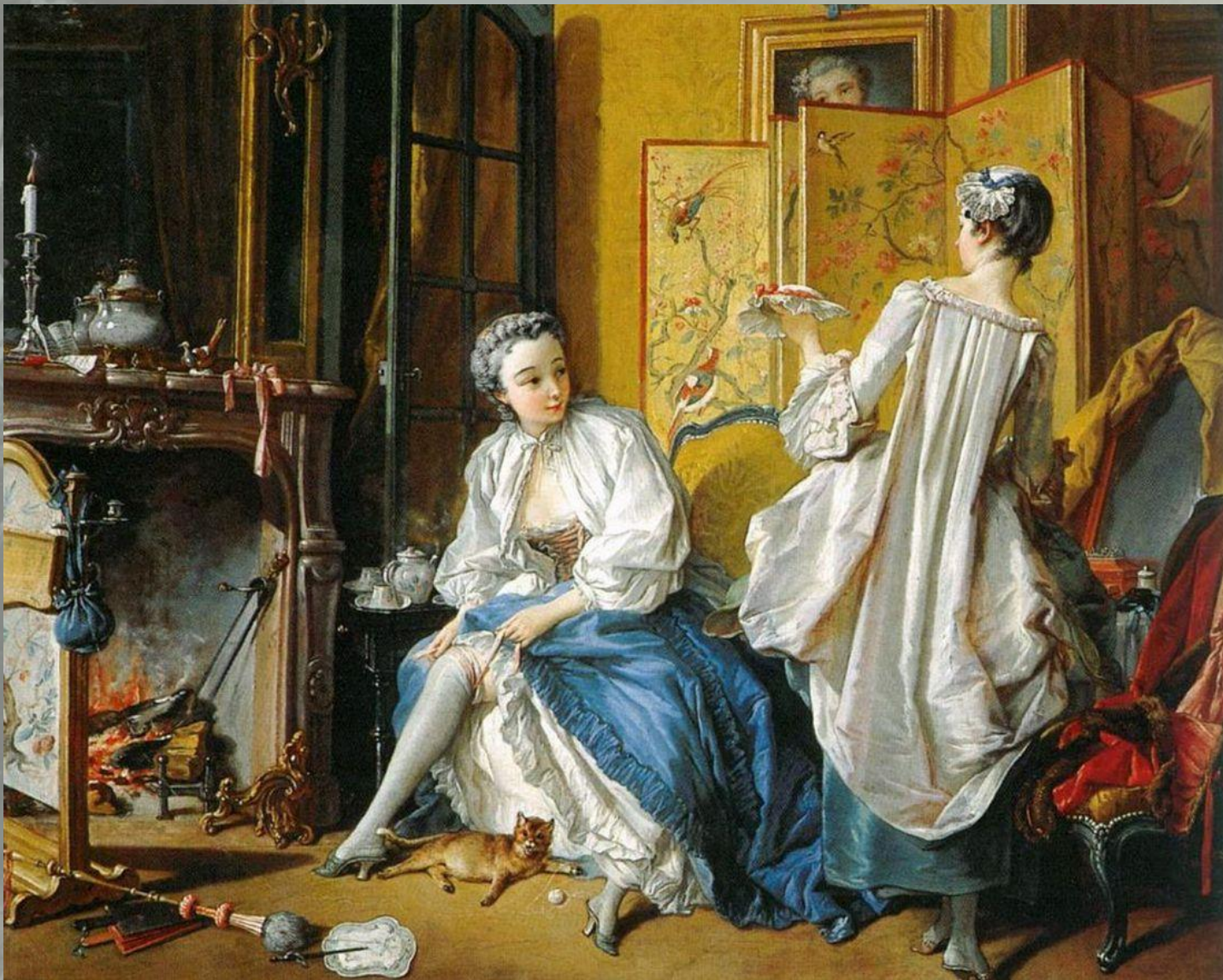
«Утро модницы» или «Дама, надевающая подвязку» 1742