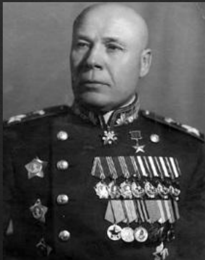
Тимошенко Семен- Маршал СССР