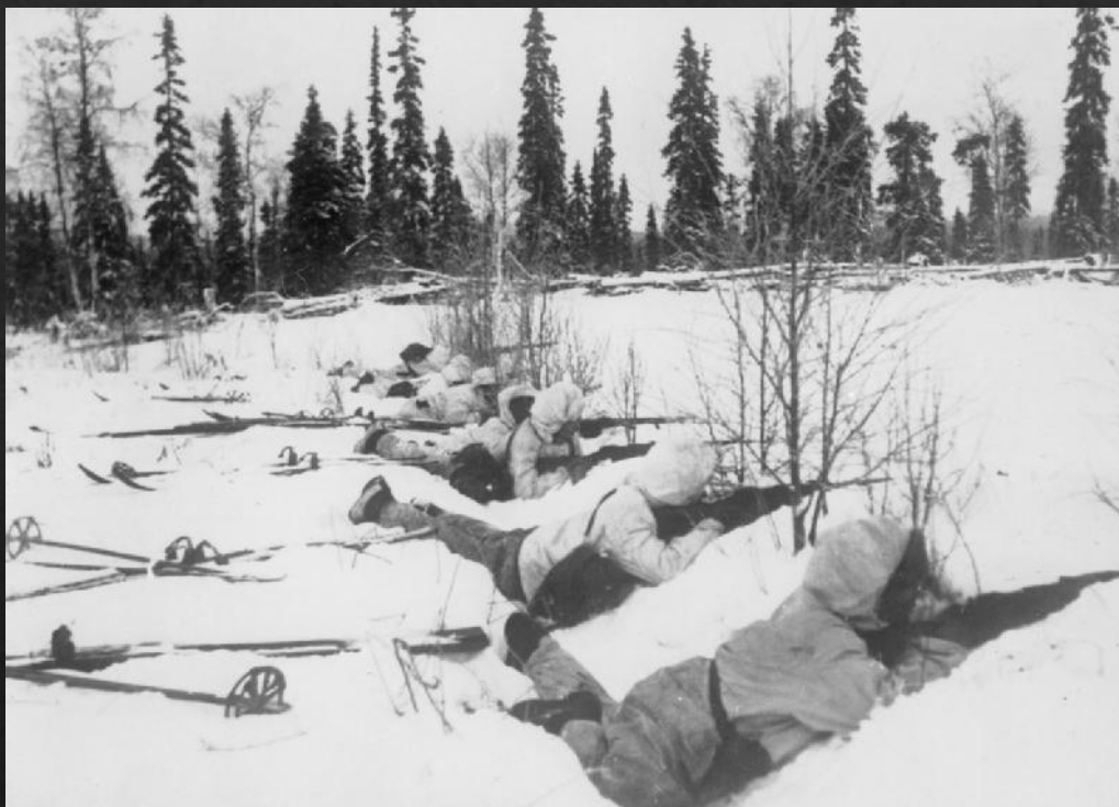
Финские лыжники 1939 г.