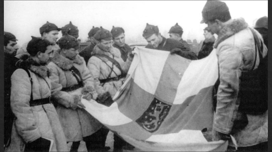
Советские солдаты с Финским флагом 1940

Поскольку атаки советских войск на район Сумма не принесли успеха, главный удар был перенесён восточнее, на направление Ляхде. В этом месте обороняющаяся сторона понесла огромные потери от артподготовки и советским войскам удалось совершить прорыв обороны.