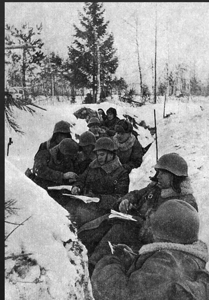
Советские солдаты в окопах.