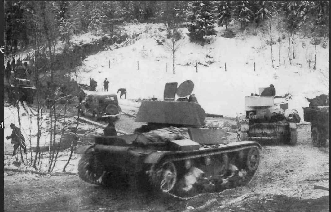
Наступление советских войск январь 1940 г

К концу декабря стало ясно, что бесплодные попытки продолжить наступление ни к чему не приведут. На фронте наступило относительное затишье. В течение всего января и начала февраля шло усиление войск, пополнение материальных запасов, реформирование частей и соединений. Были созданы подразделения лыжников, разработаны методы преодоления заминированной местности, заграждений, методы борьбы с оборонительными сооружениями, проведено обучение личного состава. Для штурма «линии Маннергейма» был создан Северо-Западный фронт под командованием командарма 1 ранга Тимошенко и члена военного совета ЛенВО Жданова. В состав фронта вошли 7-я и 13-я армии. В приграничных районах была проведена огромная работа по спешной постройке и переоборудованию путей сообщения для бесперебойного снабжения действующей армии. Общая численность личного состава была доведена до 760,5 тысяч человек.