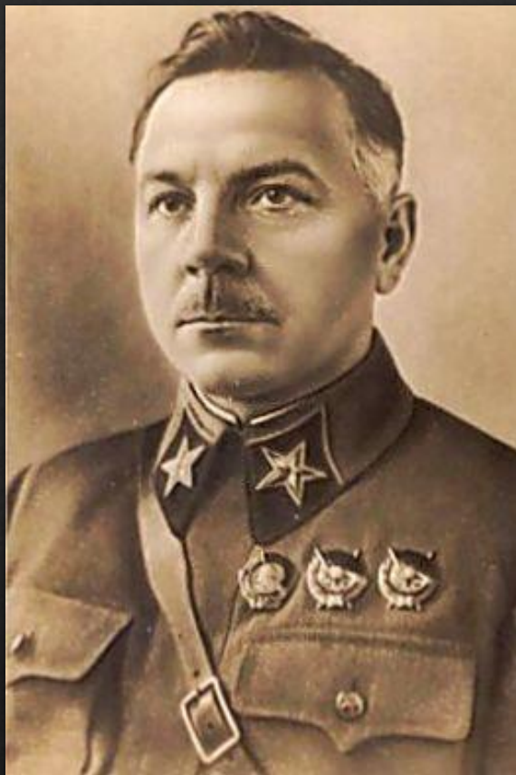
Ворошилов Климент- народный комиссар обороны СССР