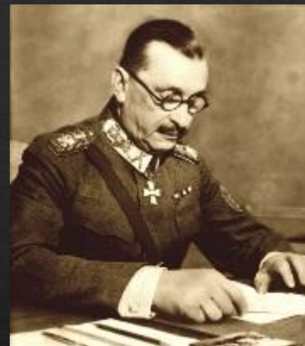
Маннергейм Карл- командующий финской армией