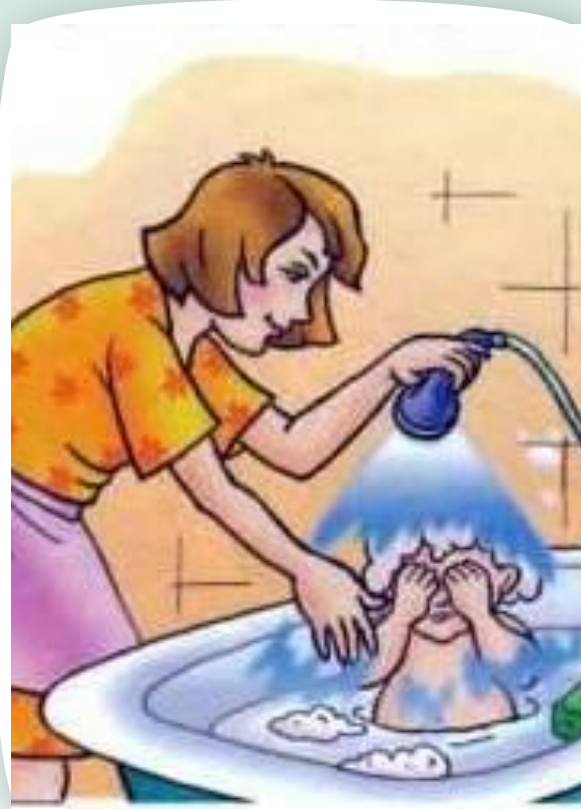
умываемый мамой малыш