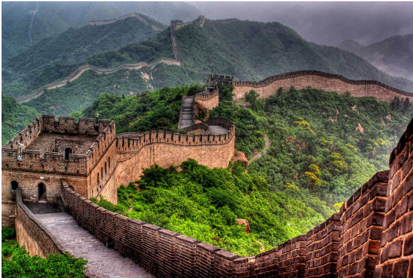
Великая Китайская стена