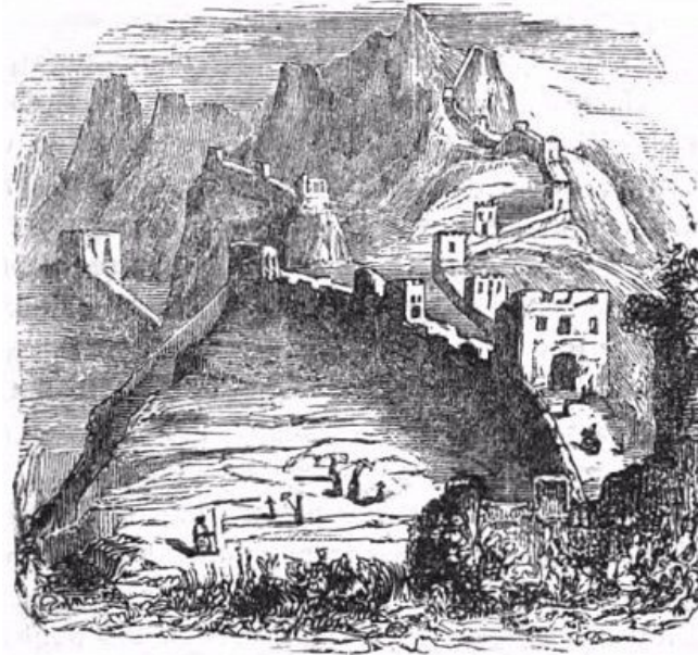
PART OF THE GREAT WALL OF CHINA.

К комфорту, хотя бы относительно, не располагала и сама местность. Сооружение пролегло вдоль горных массивов, огибая все отходящие от них отроги. Строители двигались вперед, преодолевая не только высокие подъемы, но и множество ущелий. Их жертвы оказались не напрасны – по крайней мере, с позиции сегодняшнего дня: именно такой ландшафт местности и обусловил уникальный облик чудо-сооружения. Не говоря уже о его размерах: в среднем высота стены достигает 7,5 метров, и это без учета прямоугольных зубцов (с ними получаются все 9 м). Ее ширина тоже неодинакова – внизу 6,5 м, наверху 5,5 м.