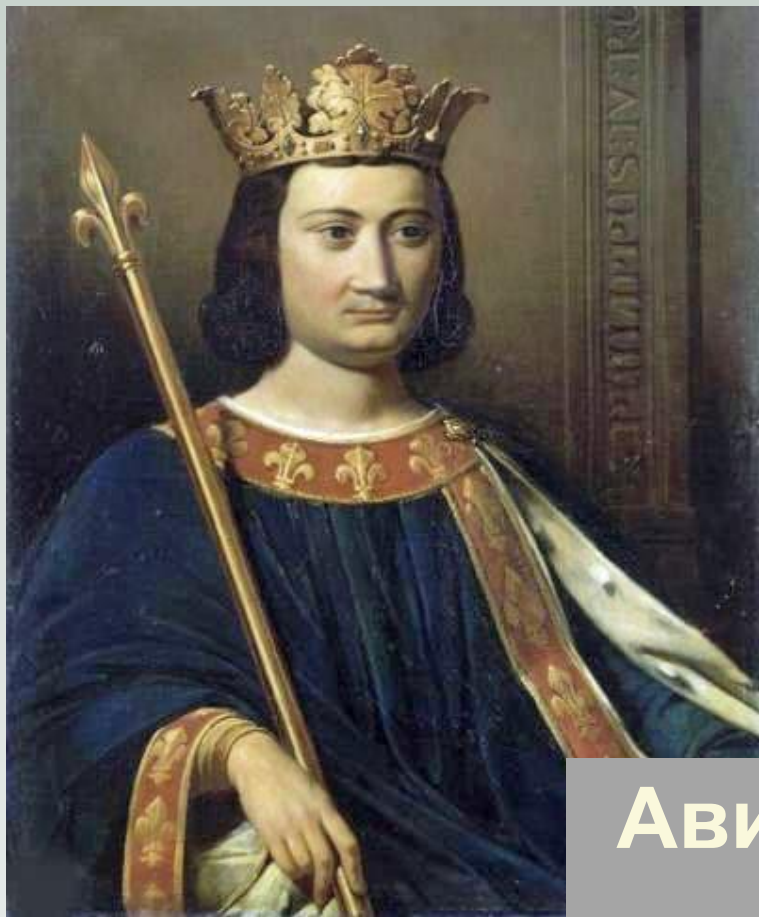
Филипп IV Красивый (1285 – 1314)