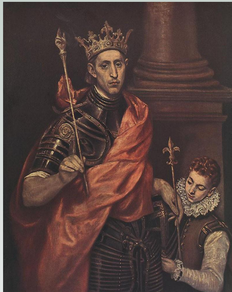
Людовик IX Святой (1226 – 1270)