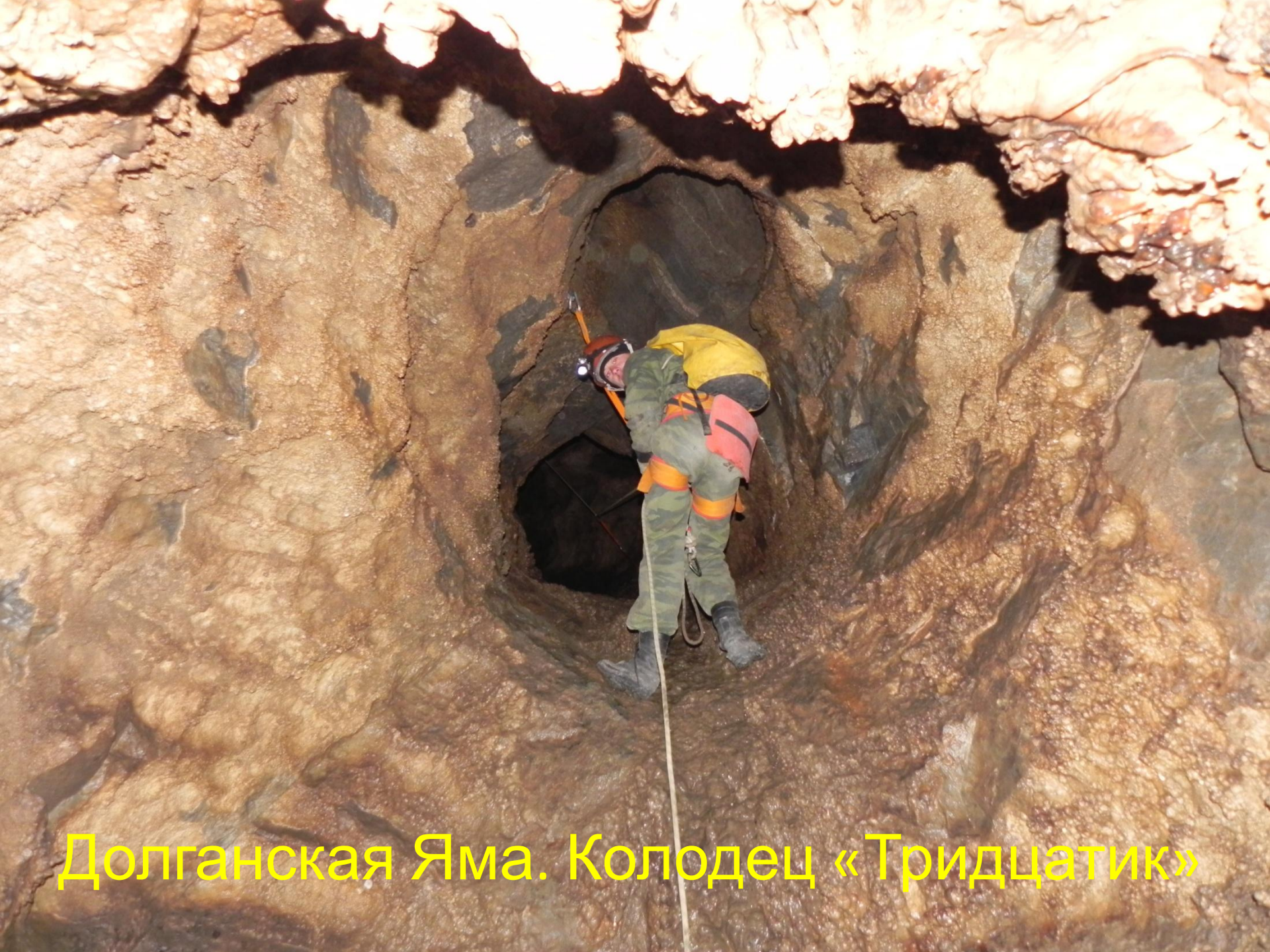
Долганская Яма. Колодец «Тридцатик»