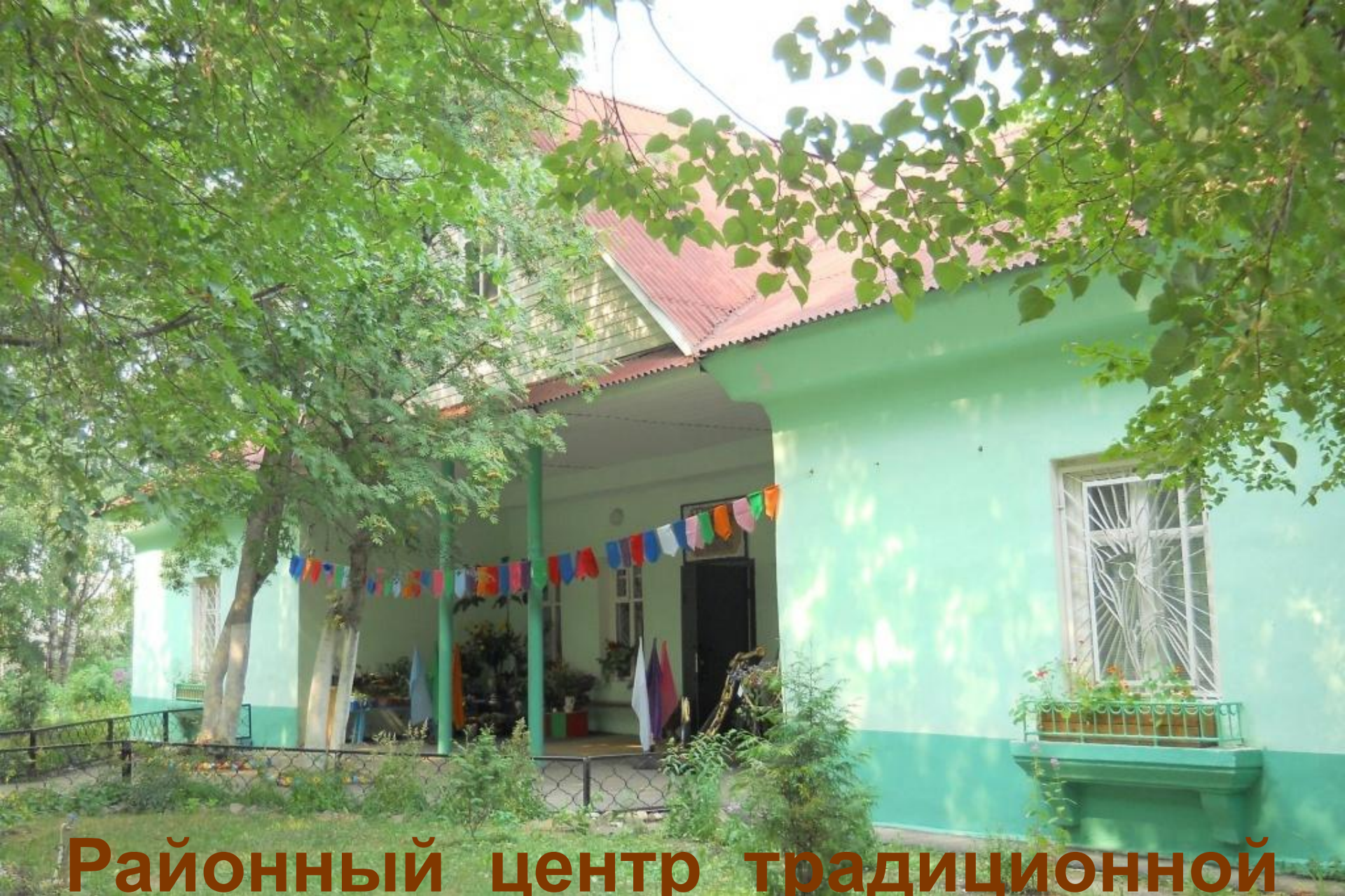
Районный центр традиционной народной культуры п.Шексна