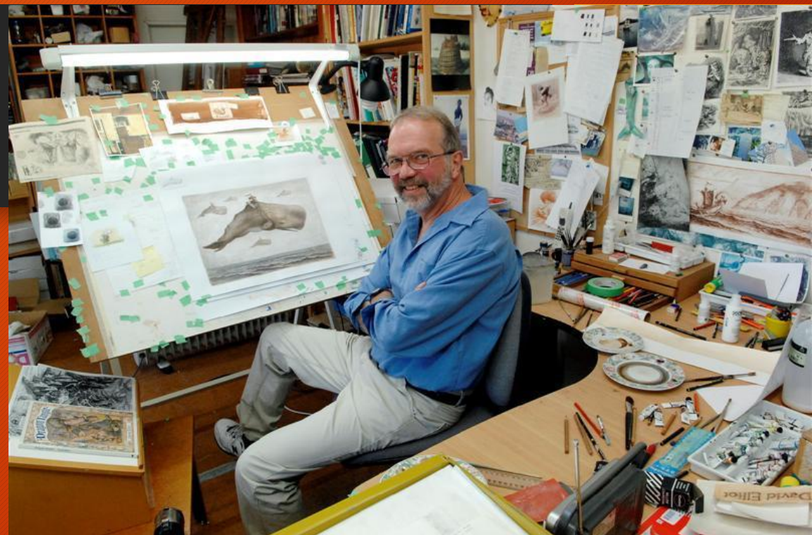
Иллюстрация особыми техниками

Данное искусство востребовано в следующих сферах: литература и пресса; плакаты, постеры – полиграфия; мультипликация – раскадровка; интернет-баннеры, состоящие из иллюстраций; рекламная продукция