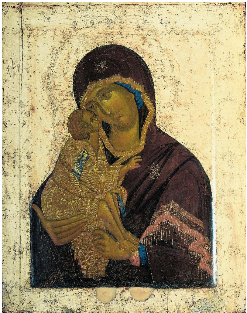
Донская икона Божией Матери