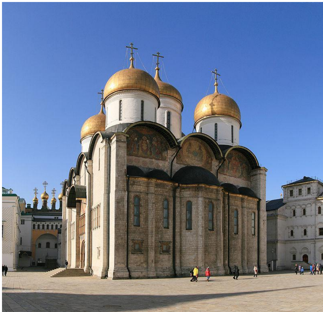
Успенский собор Московского Кремля