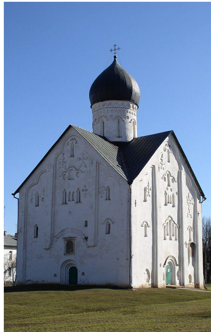
Церковь Спаса Преображения на Ильине улице (Новгород)