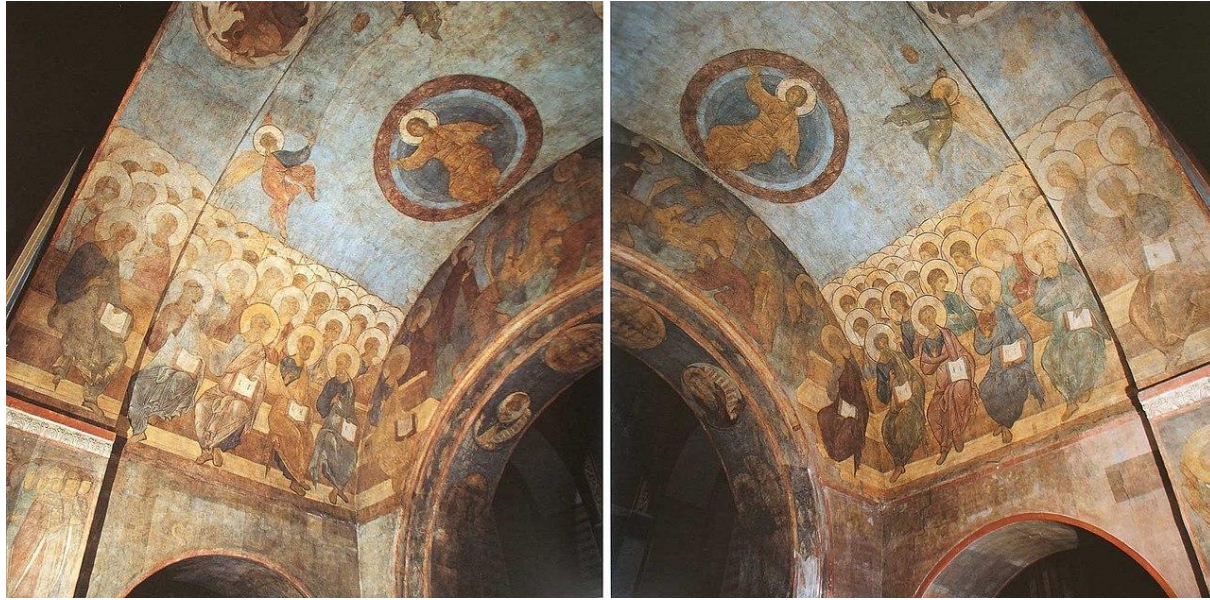
Фрески Андрея Рублёва и Даниила Чёрного Успенский собор во Владимире