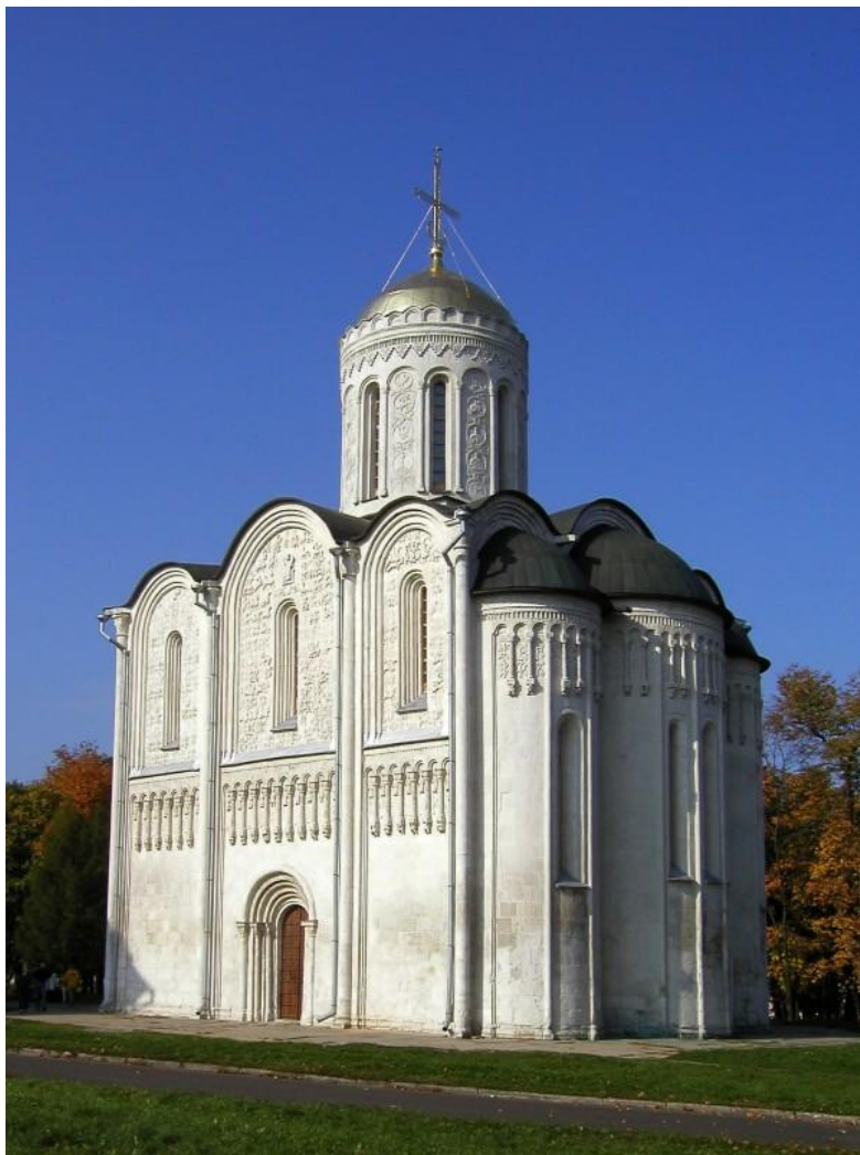
Дмитровский собор во Владимире. 1191 год. Современный вид