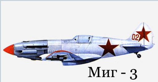
МиГ - 3

С Советской стороны против немцев сражались лётчики на самолётах МиГ-3, истребителях ЛаГГ-3, Як-1Б, Ла-5, штурмовиках Ил-2, бомбардировщиках Пе-2, Ил-4, а также на «Аэрокобрах».