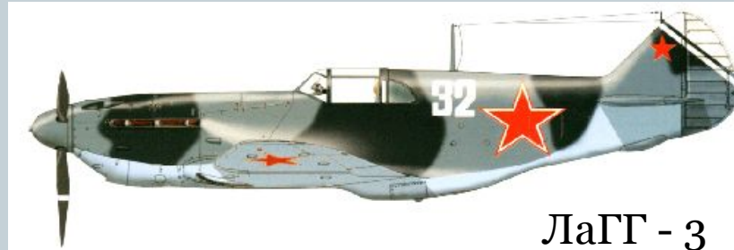
ЛаГГ - 3