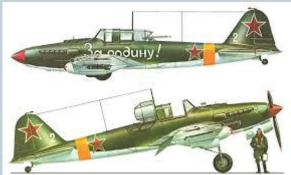
Ил - 2