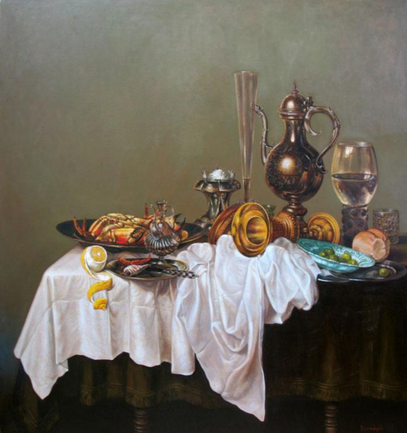
В. Хед «Завтрак с омаром»