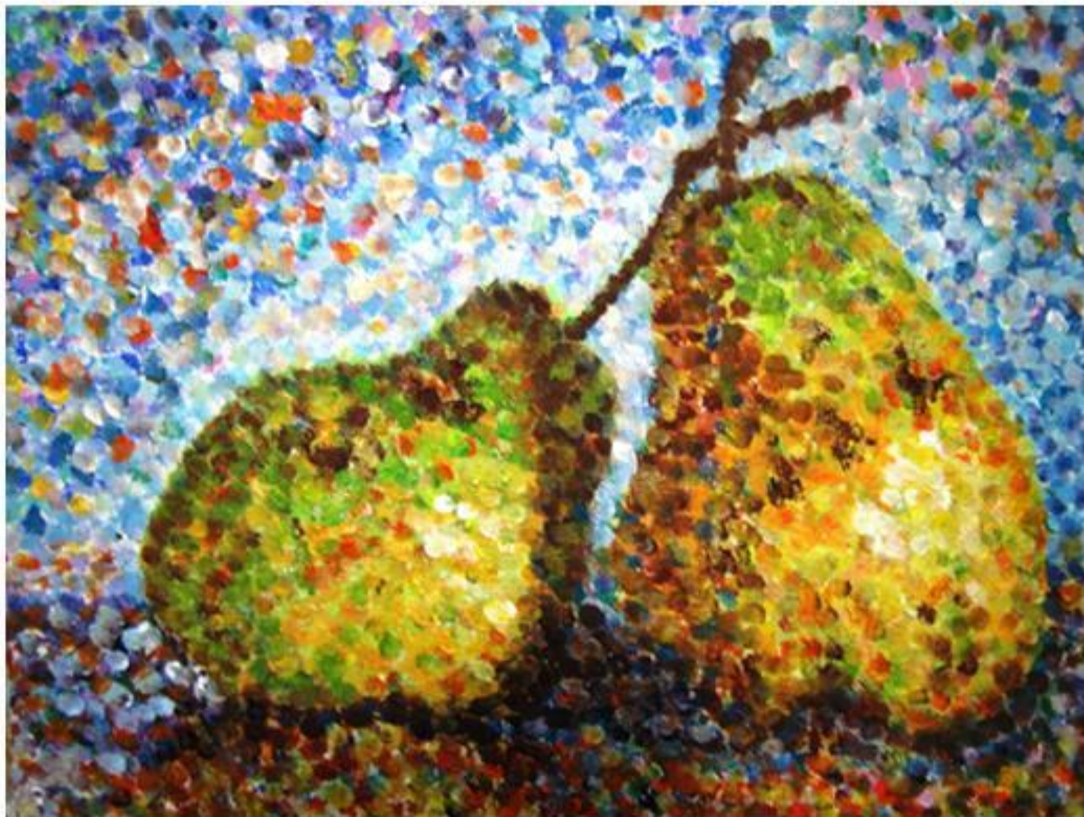
Натюрморт в технике пуантилизм