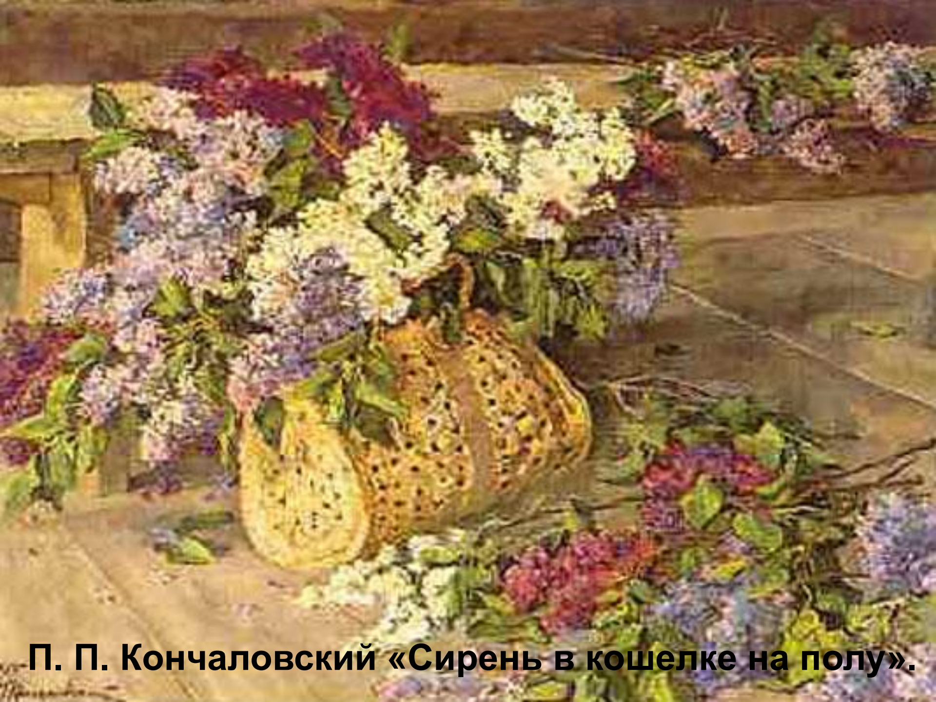
П. П. Кончаловский «Сирень в кошелке на полу».