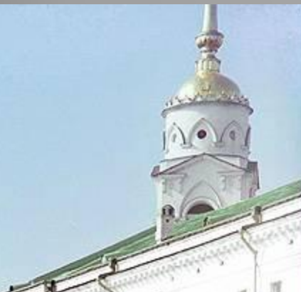
Золотые ворота во Владимире