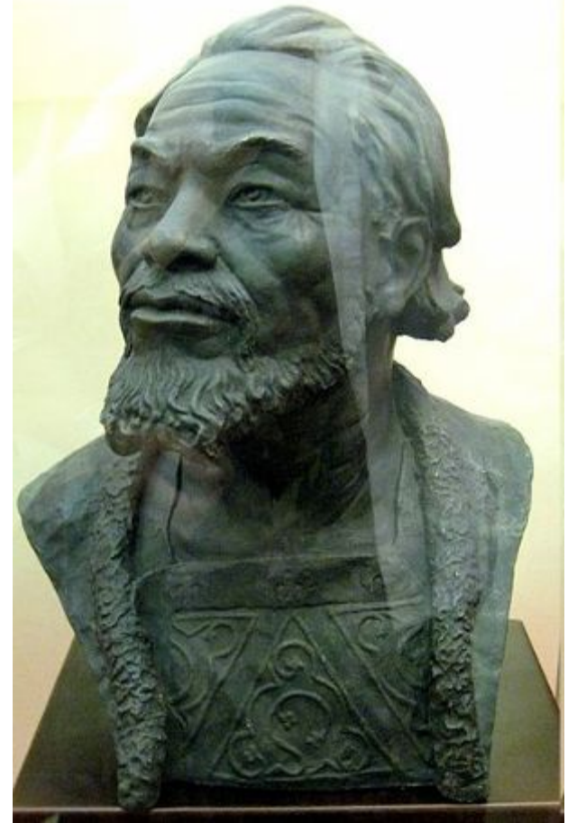
Скульптурный портрет- реконструкция М. Герасимова