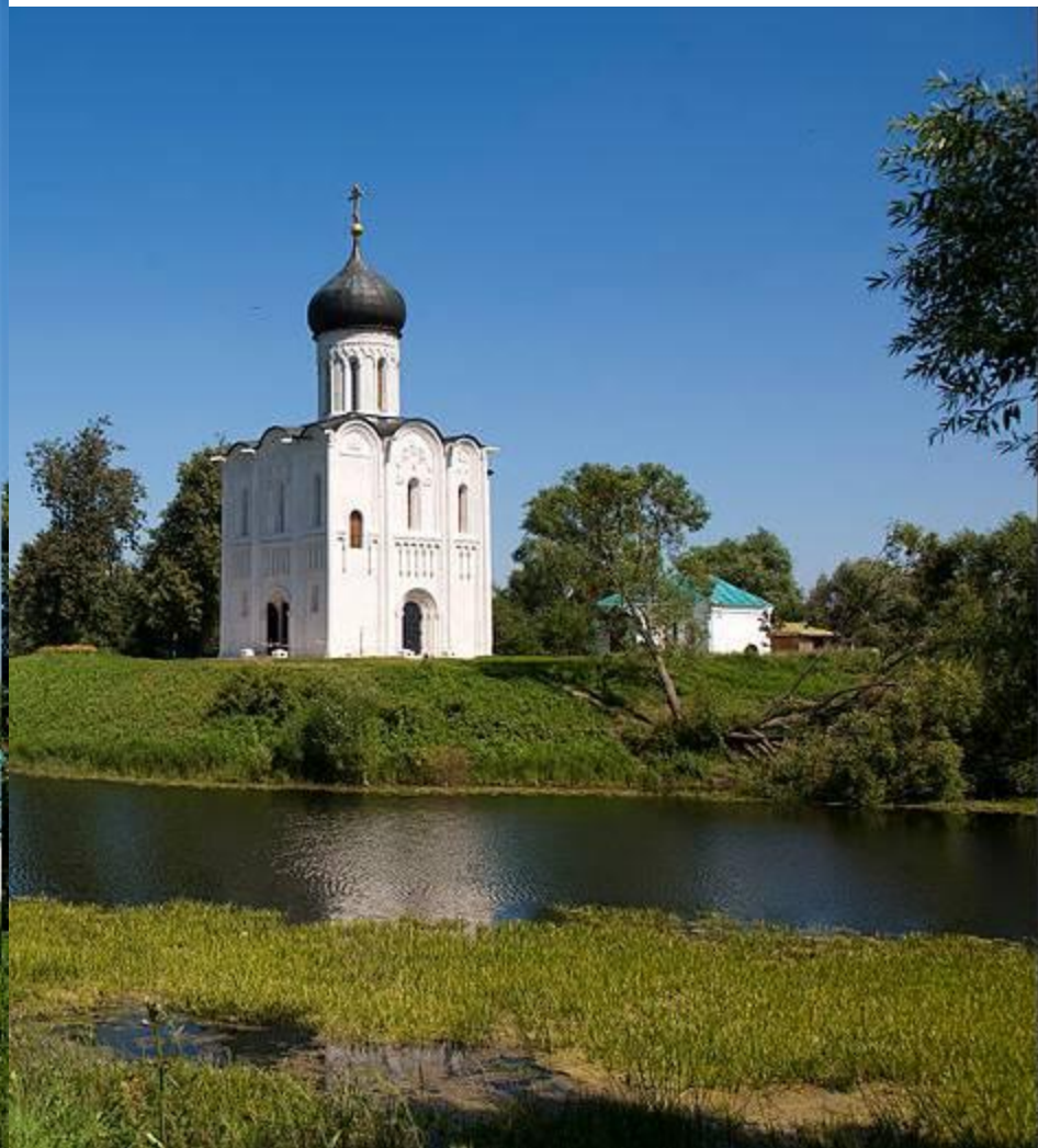
Покрова на Нерли