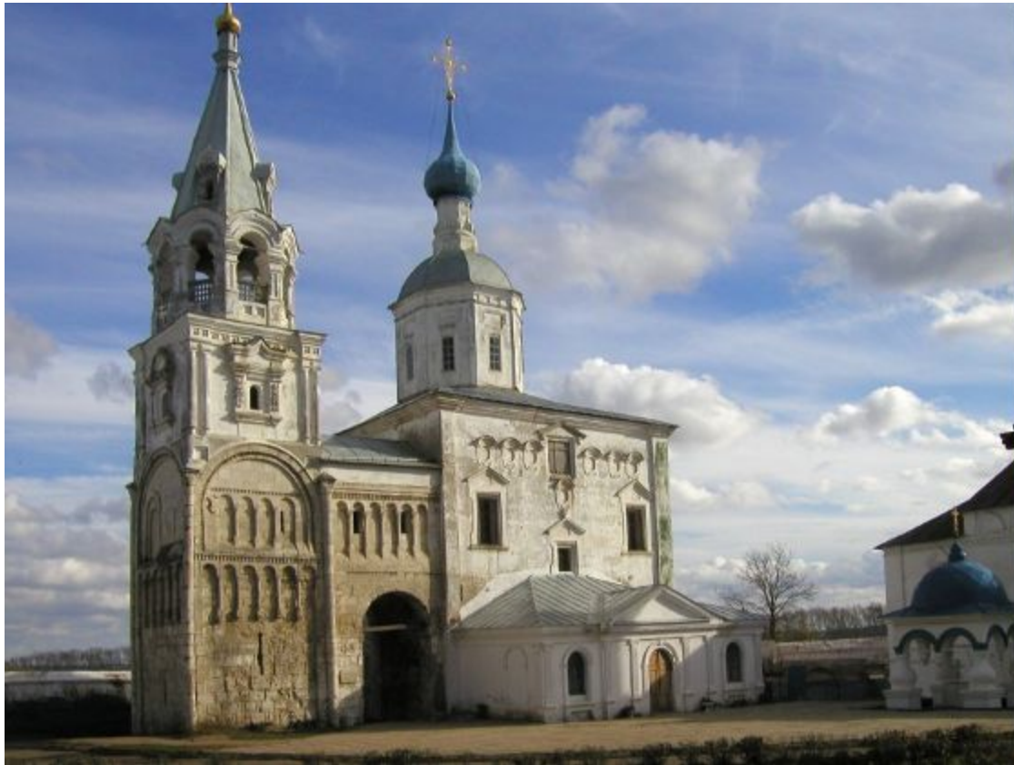
Храм Рождества Богородицы и остатки палат в Боголюбове