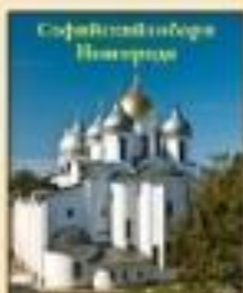
Строительство церквей и монастырей