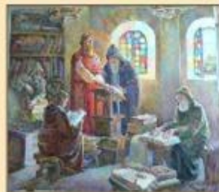
Создание первой библиотеки Руси