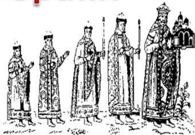
Изображение Ярослава Мудрого и его семьи (фреска Софийского собора в Киеве).

Сын Всеволод женился на дочери Византийского короля Константина Анастасии.