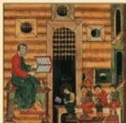
Открытие школ при церквях