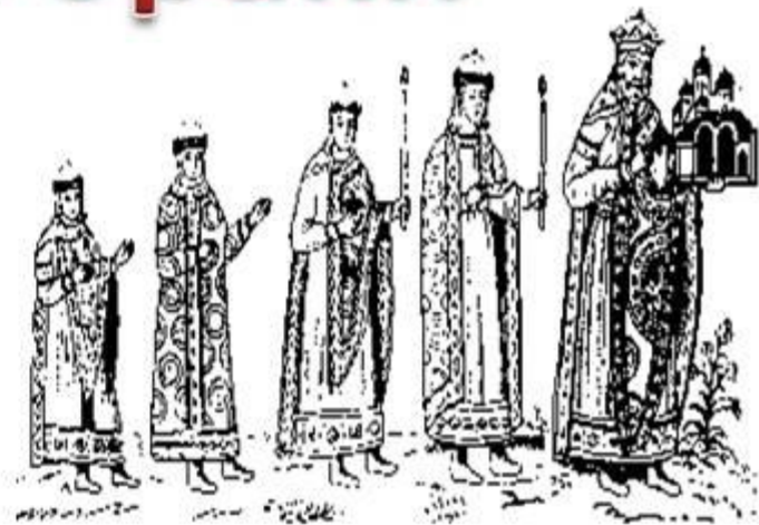
Изображение Ярослава Мудрого и его семьи (фреска Софийского собора в Киеве).

Сын Всеволод женился на дочери Византийского короля Константина Анастасии.