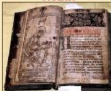
Перевод церковных книг на славянский язык