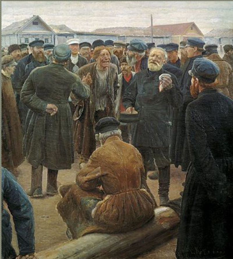
С.Коровин. На миру.