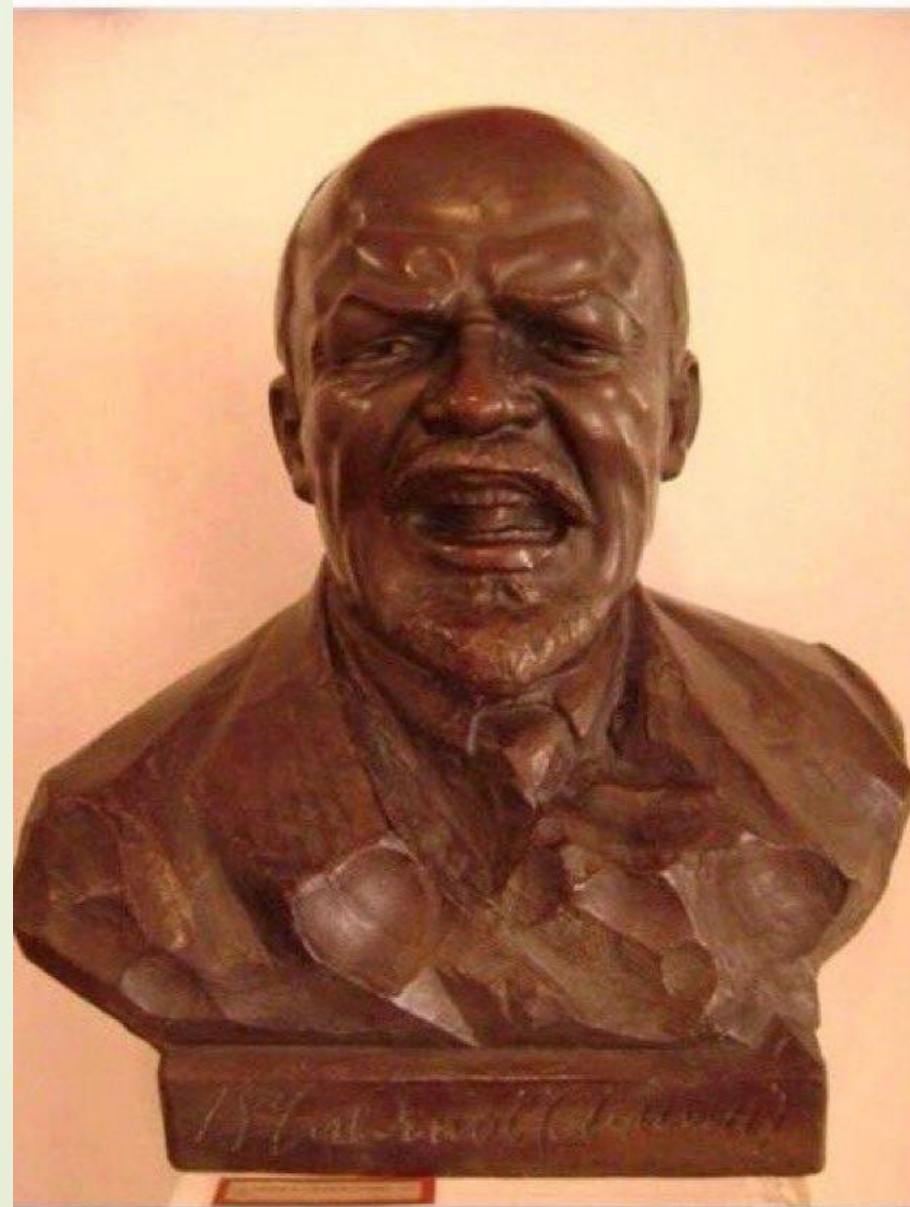
Ленин произносит артикль the. Георгий Лавров. 1924.