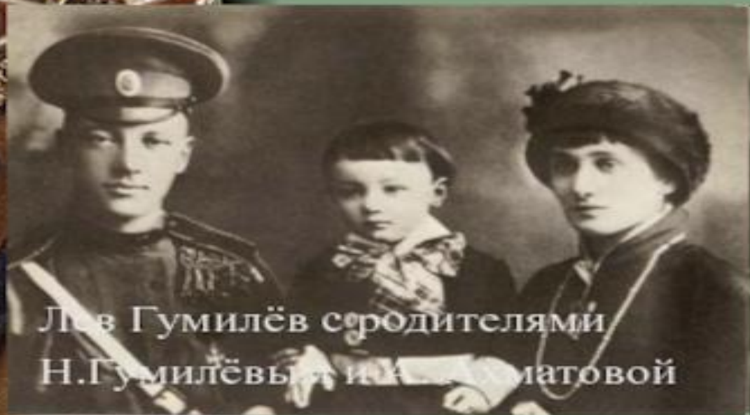
Лев Гумилёв с родителями Н.Гумилёвой и А.Ахматовой

Наши писатели и поэты в своих произведениях наиболее ярко описали тему репрессий, где показали трагедию нашего народа. Это “Дети Арбата” Анатолия Рыбакова, “Архипелаг Гулаг” Александра Солженицына, стихотворение Осипа Мандельштама, поэма “Реквием” Анны Ахматовой.