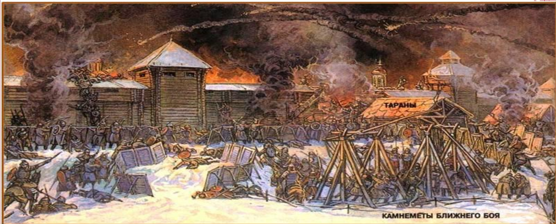
КАМНЕМЕТЫ БЛИЖНЕГО БОЯ

В 1219-1220 гг. Чингисхан захватил Среднюю Азию. Затем монгольское войско продвинулось в Северный Иран, вошло в Азербайджан и появилось на Северном Кавказе. В Крыму монголы овладели городом Сурожем.