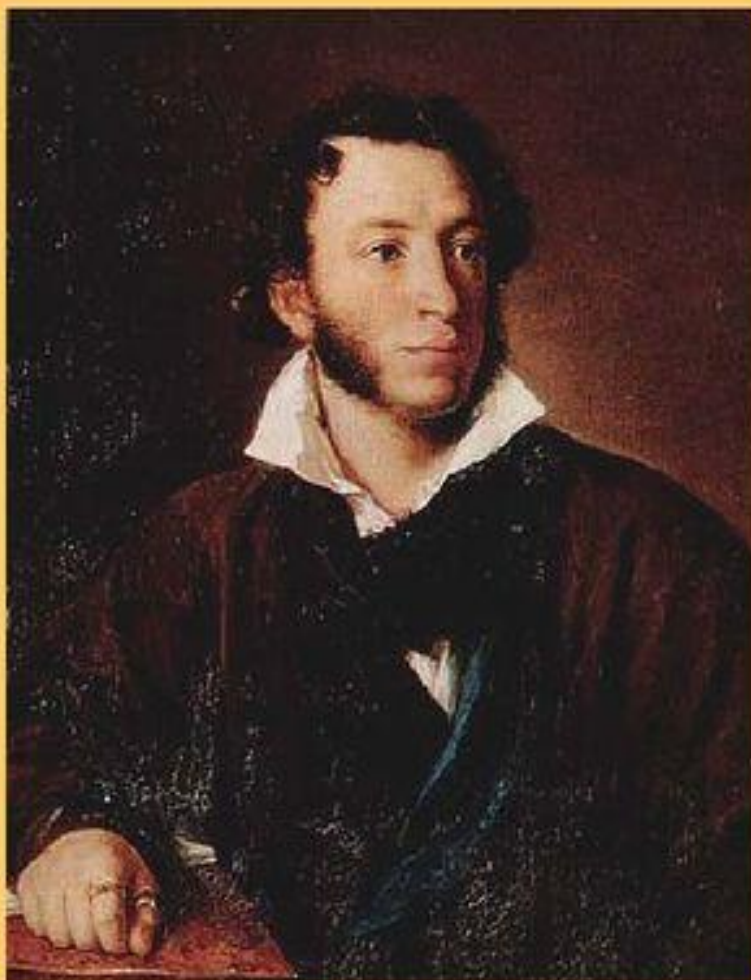
Пушкин Александр Сергеевич (1799 – 1837)