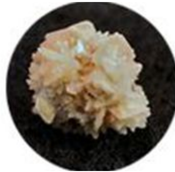
Камень слюнных желез