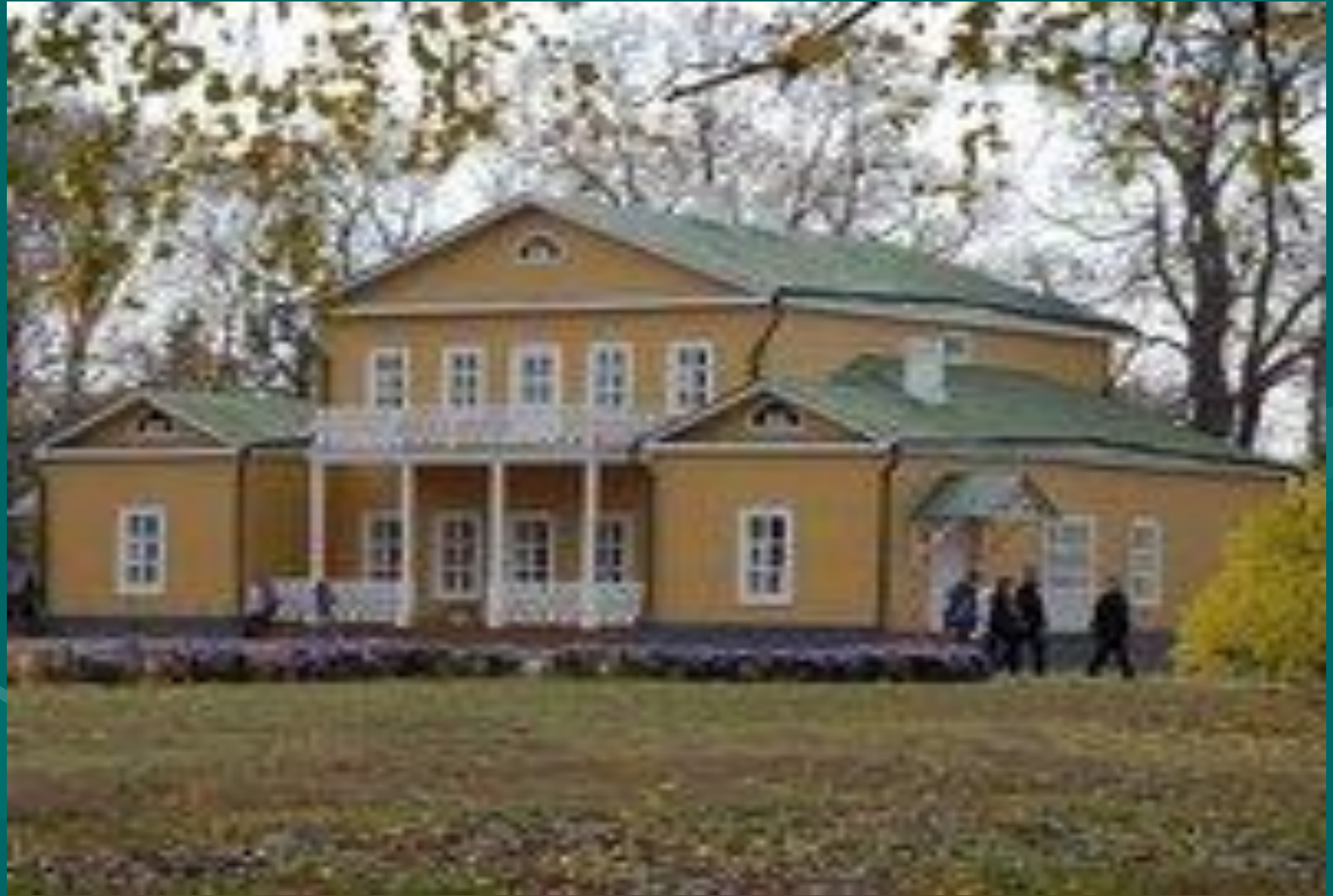
село Тарханы Пензенской губернии