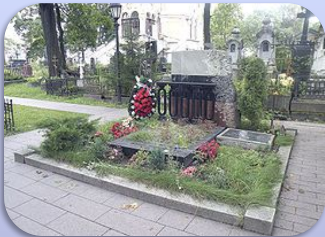
Могила Г. В. Старовойтовой