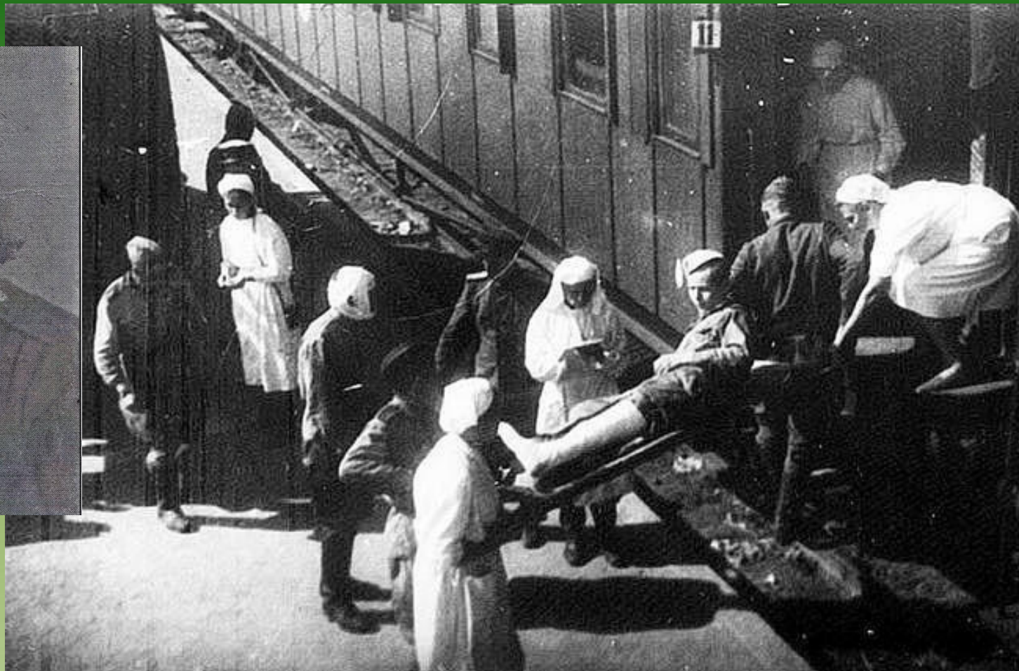
Погрузка раненых в санитарный поезд.