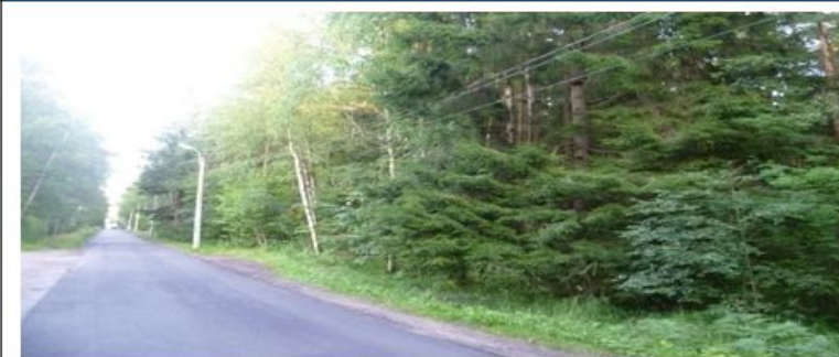
Западная поворотная точка. ул. Танкистов - к Зеленогорскому ш.