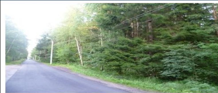
Западная поворотная точка. ул. Танкистов - к Зеленогорскому ш.