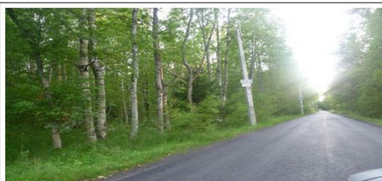
Восточная поворотная точка ул. Танкистов - от Зеленогорского ш. к Финскому Заливу - слева земельный уч. №2