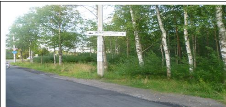
Вид на Зеленогорское ш.– справа земельный уч. №2