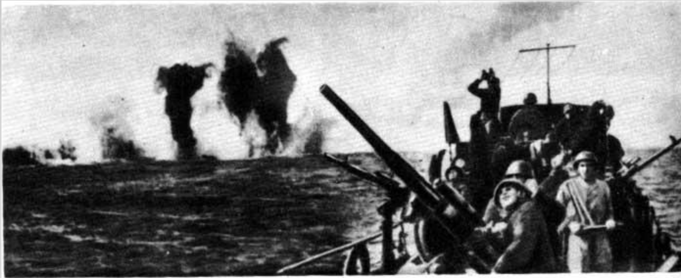
Отражение атаки вражеских самолетов

4:00 командующий Черноморским флотом вице-адмирал Ф. С. Октябрьский доложил наркомму обороны о том, что налет вражеской авиации отражен.