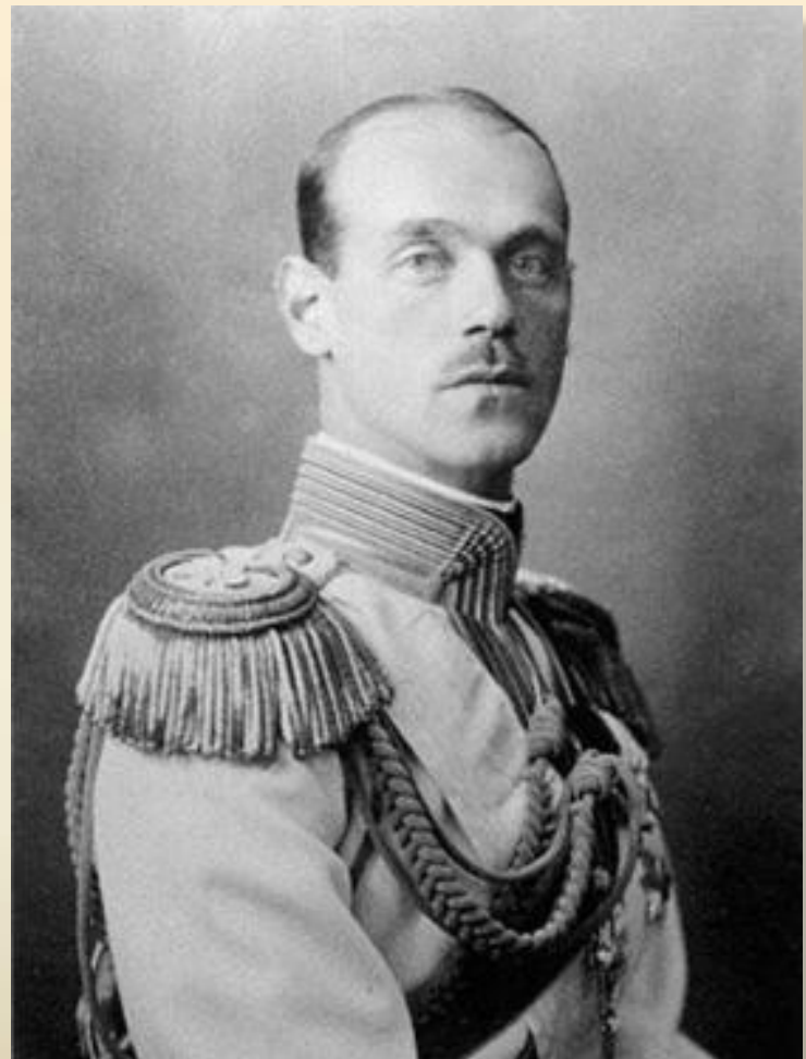
Михаил I Федорович Михаил II Александрович