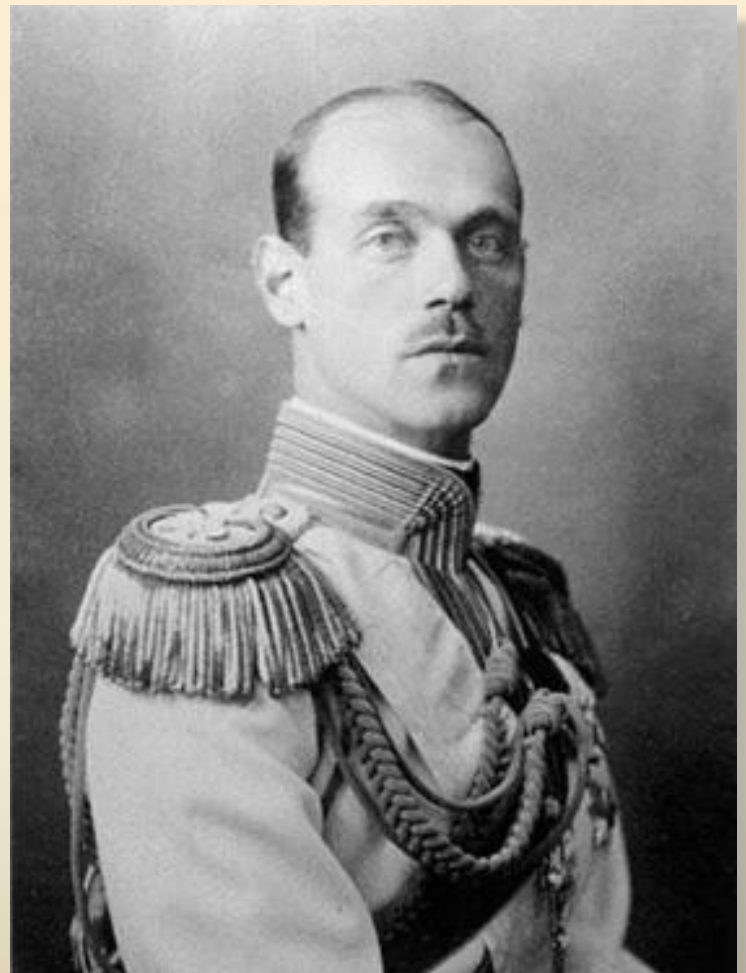
Михаил I Федорович Михаил II Александрович