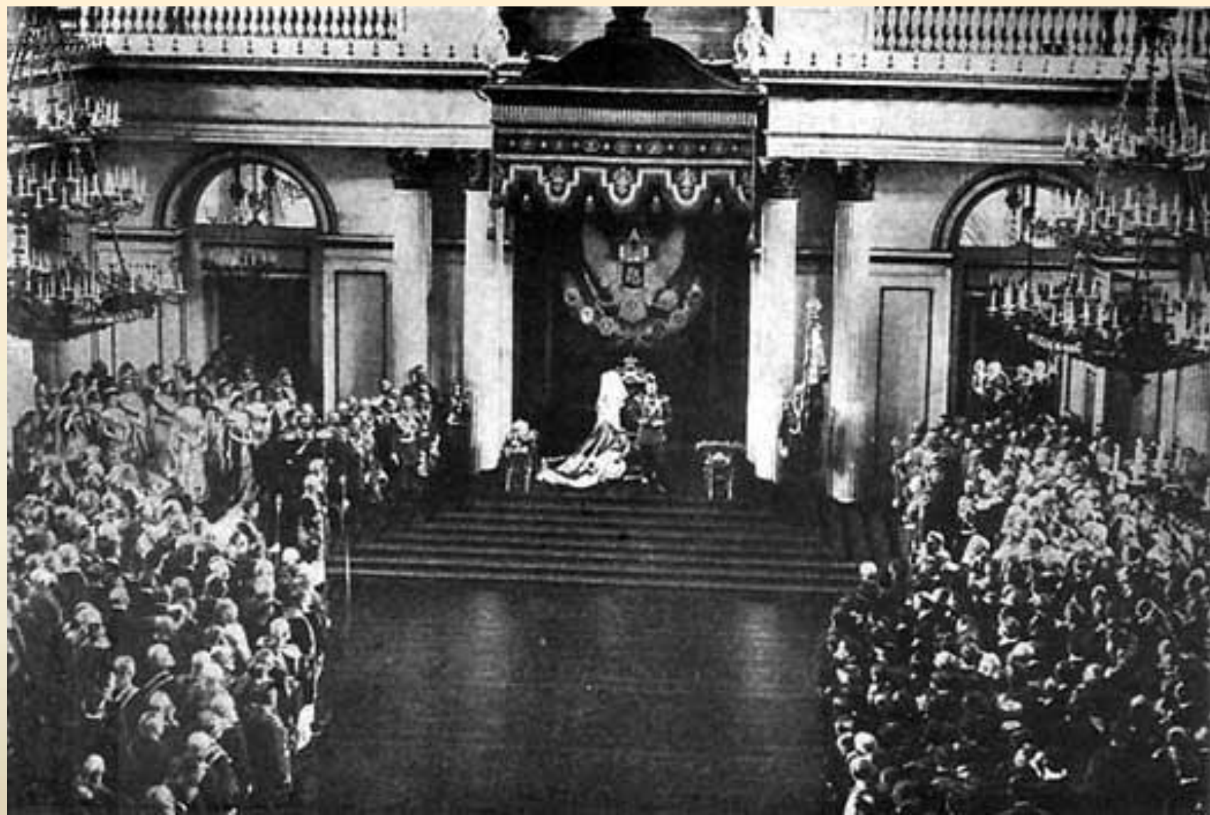
Публичное выступление Николая II 17 января