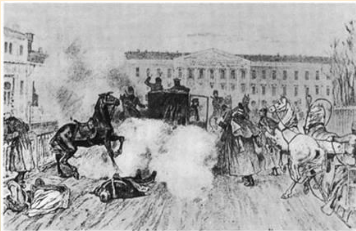
Убийство Александра II в 1881 году