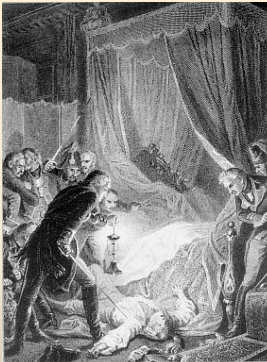
Убийство Павла I 11 марта 1801 года