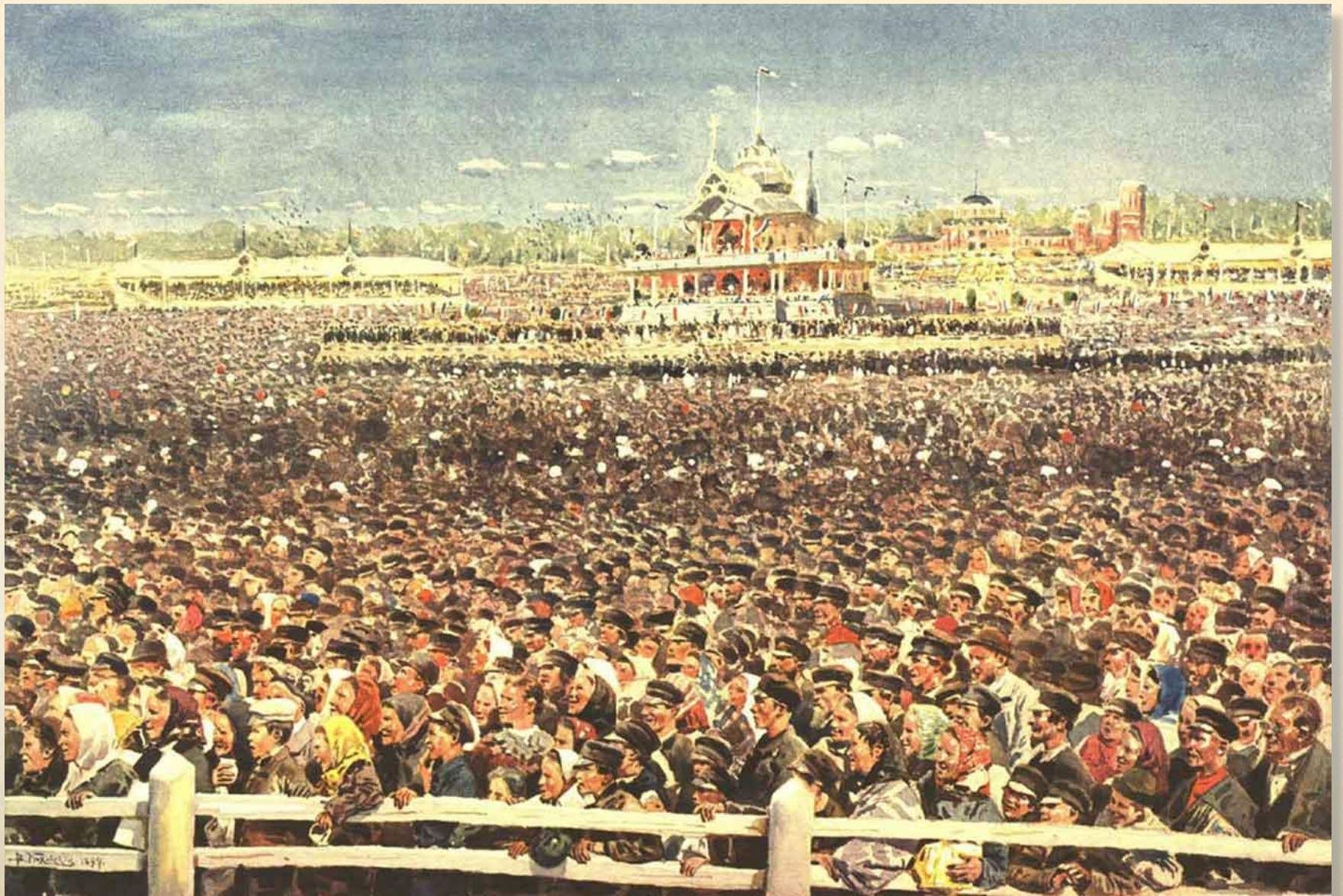
Празднество на Ходынском поле 17 мая