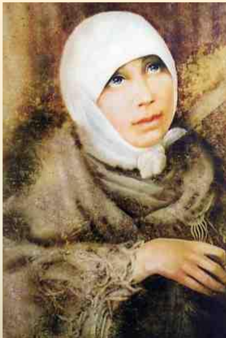
Блаженная Марфа Царицынская