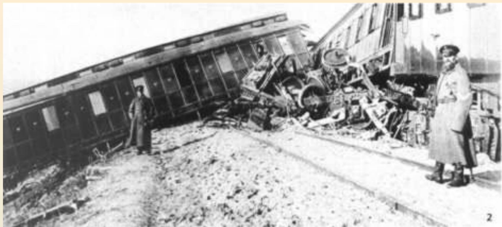
Крушение царского поезда 17 октября