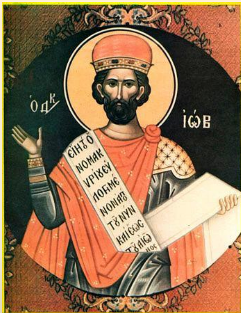
Праведный Иов Многострадальный