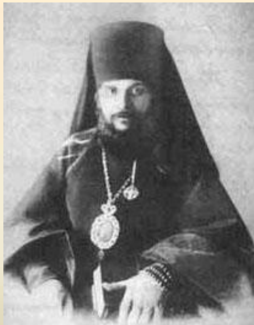
Патриарх Гермоген Епископ Тобольский Гермоген