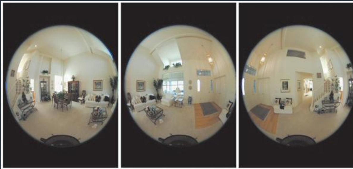
Приложение №1 Исходные фотографии