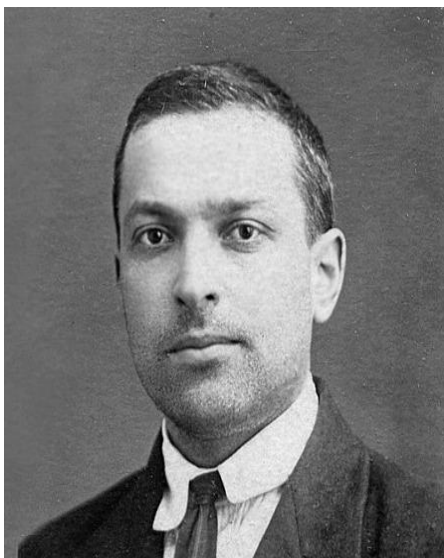
Л. С. Выготский