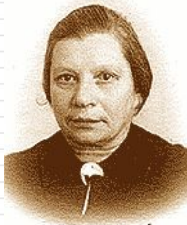
Ж. И. Шиф