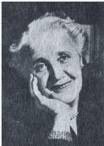
Г. Е. Сухарева