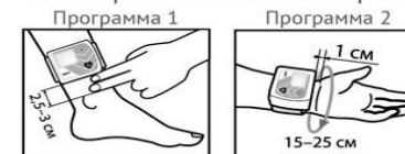
Схема расположения аппарата:

СПРАШИВАЙТЕ О СКИДКАХ У ВАШЕГО КОНСУЛЬТАНТА