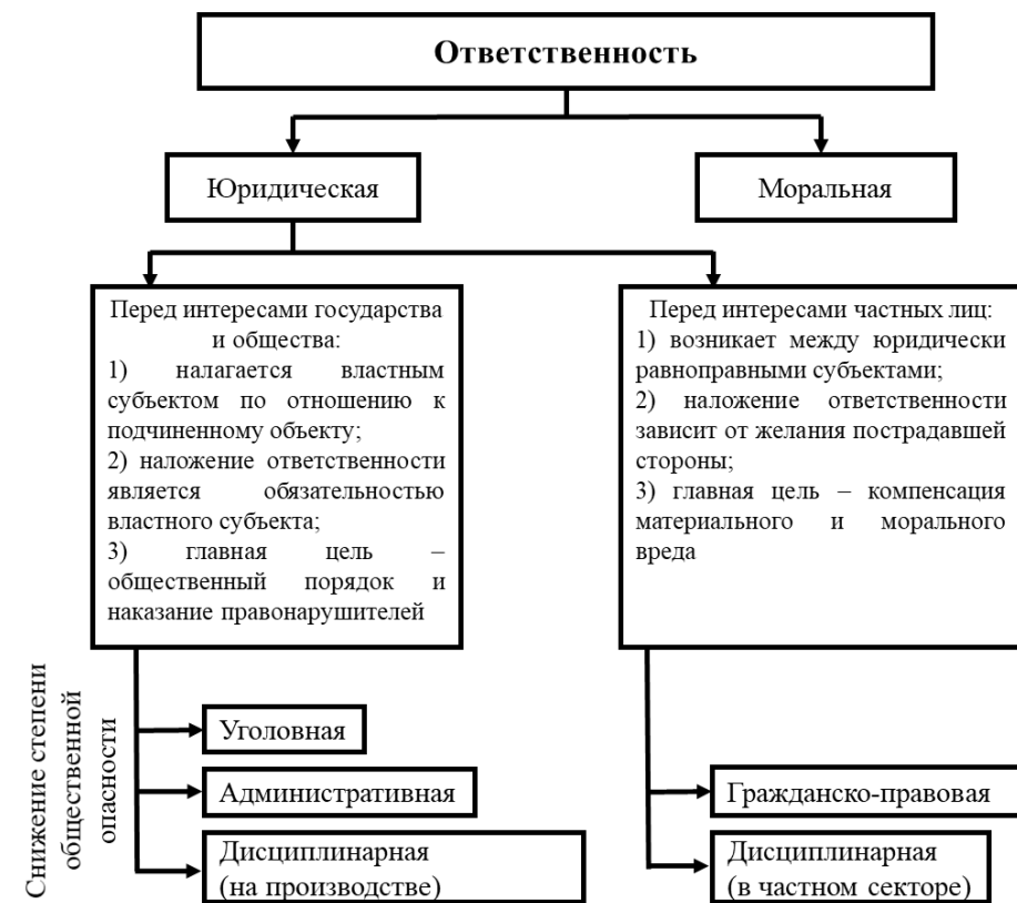
Общая схема и характеристика видов ответственности