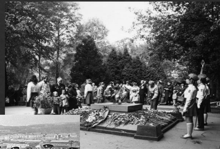
Вечный огонь у военного мемориала на Преображенском кладбище, Москва.

Факел с огнем был доставлен из Ленинграда по эстафете всего за один день. У Манежной площади ценный груз принял знаменитый летчик Герой Советского Союза Алексей Маресьев.