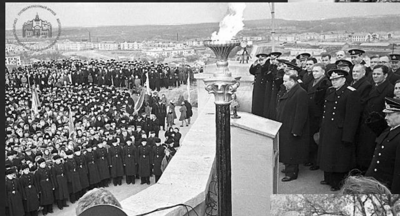
Зажжение вечного огня на Малаховом кургане. Севастополь. 1958 г.