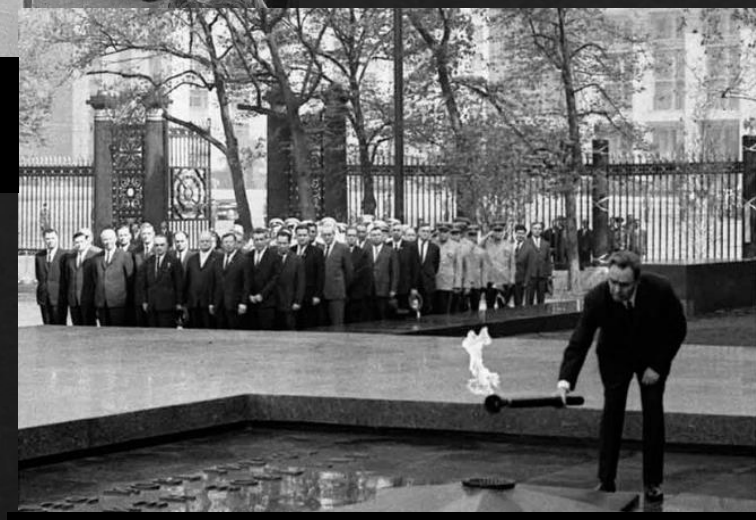
Церемония зажжения Вечного огня у Могилы Неизвестного солдата. Москва. 8 мая 1967 г.