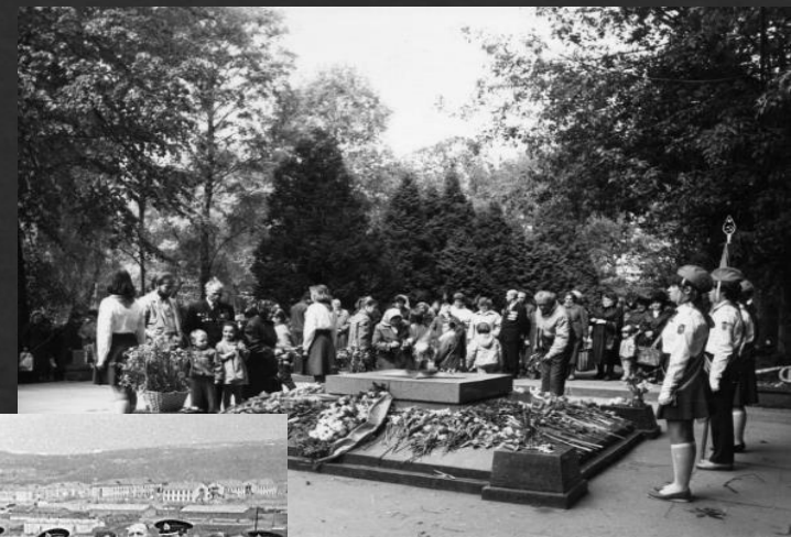
Вечный огонь у военного мемориала на Преображенском кладбище, Москва.

Факел с огнем был доставлен из Ленинграда по эстафете всего за один день. У Манежной площади ценный груз принял знаменитый летчик Герой Советского Союза Алексей Маресьев.