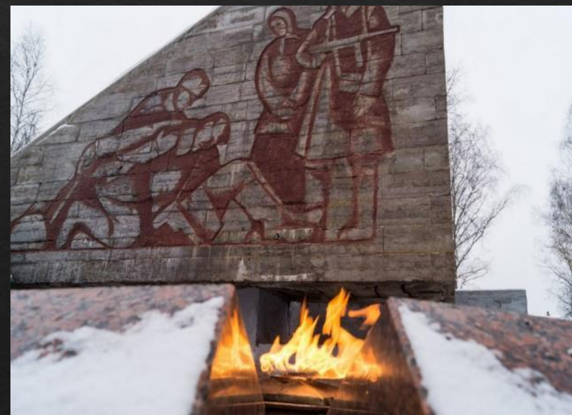
Мемориал «Славы» в Старой Руссе. Новгородская обл. Открыт в 1964 г.