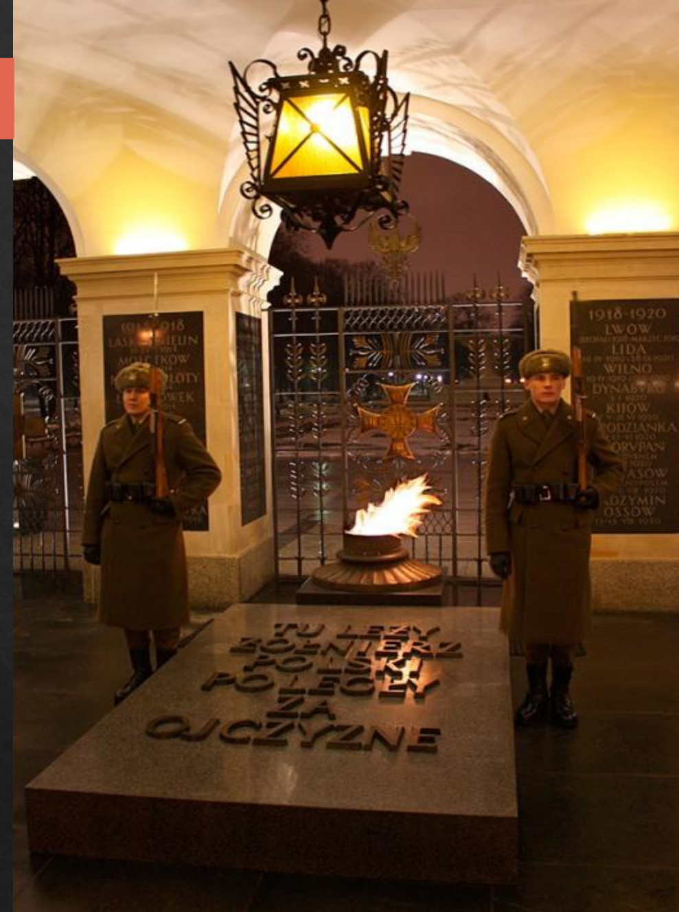
Могила Неизвестного солдата. Варшава, Польша

Он стал источником пламени для большинства воинских мемориалов , открытых в городах-героях, а также городах воинской славы.