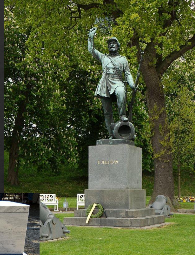
«Неизвестный пехотинец», Фредориция, Дания