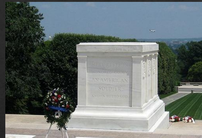
Штат Вирджиния, США