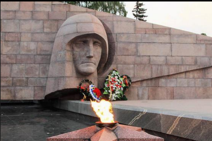
Памятник "Скорбящей матери-Родине". Самара. Открыт в 1971 г.