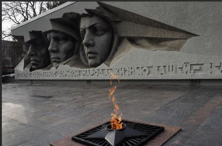
Мемориал «Вечная слава». Ставрополь. Открыт в 1967г.