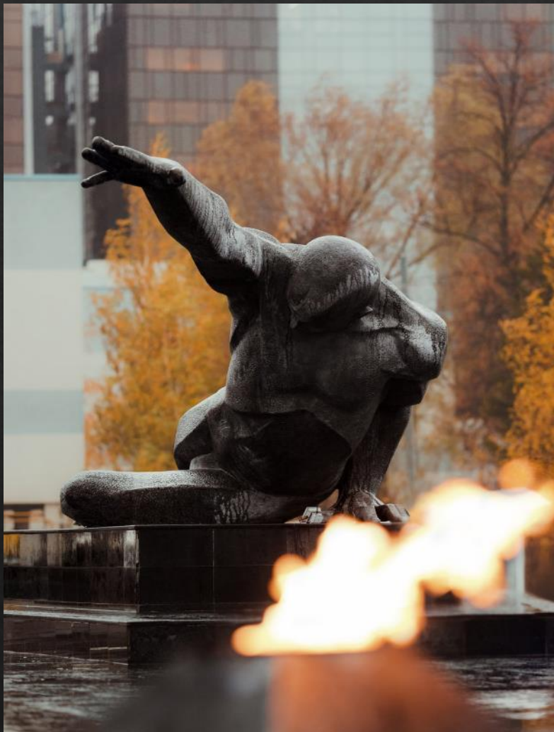
Памятник «Неизвестному солдату». Казань. Открыт в 1967г.