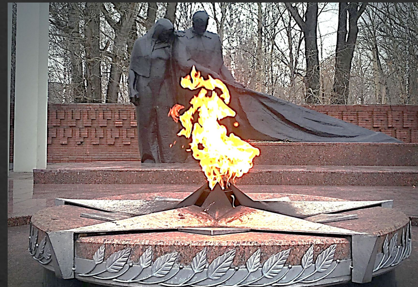
Мемориал «Вечный огонь». Тюмень. Открыт в 1968 г.