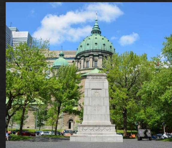
Кенотаф. Монреаль, Канада