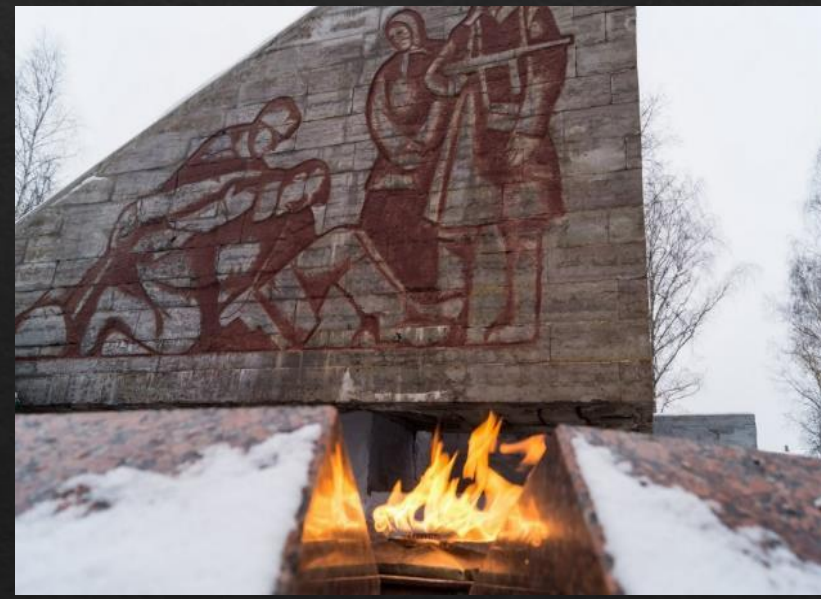
Мемориал «Славы» в Старой Руссе. Новгородская обл. Открыт в 1964 г.