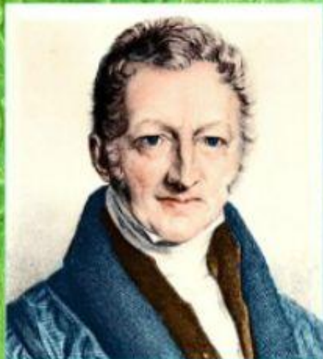
Томас Мальтус (1766—1834)

В 1798 году была опубликована книга Essay on the Principlea of Population («Очерк о законе народонаселения»)