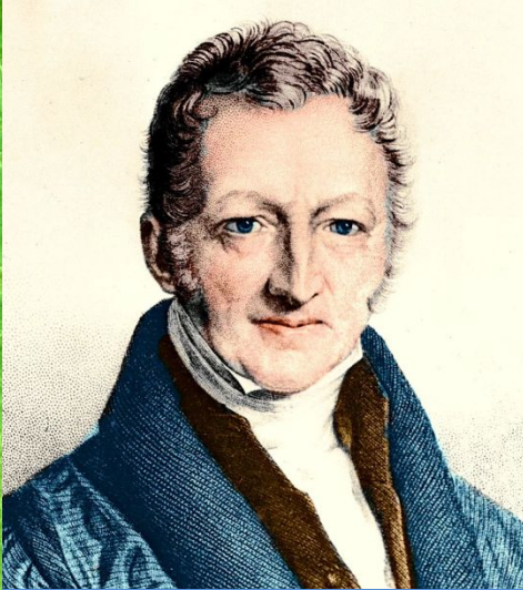
Томас Мальтус (1766—1834)

В 1798 году была опубликована книга Essay on the Principlea of Population («Очерк о законе народонаселения»)