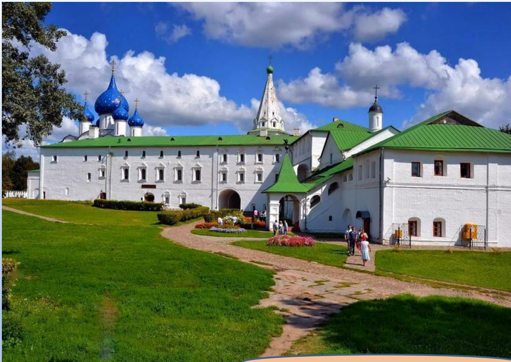
Архиерейские палаты с трапезной епископской церковью