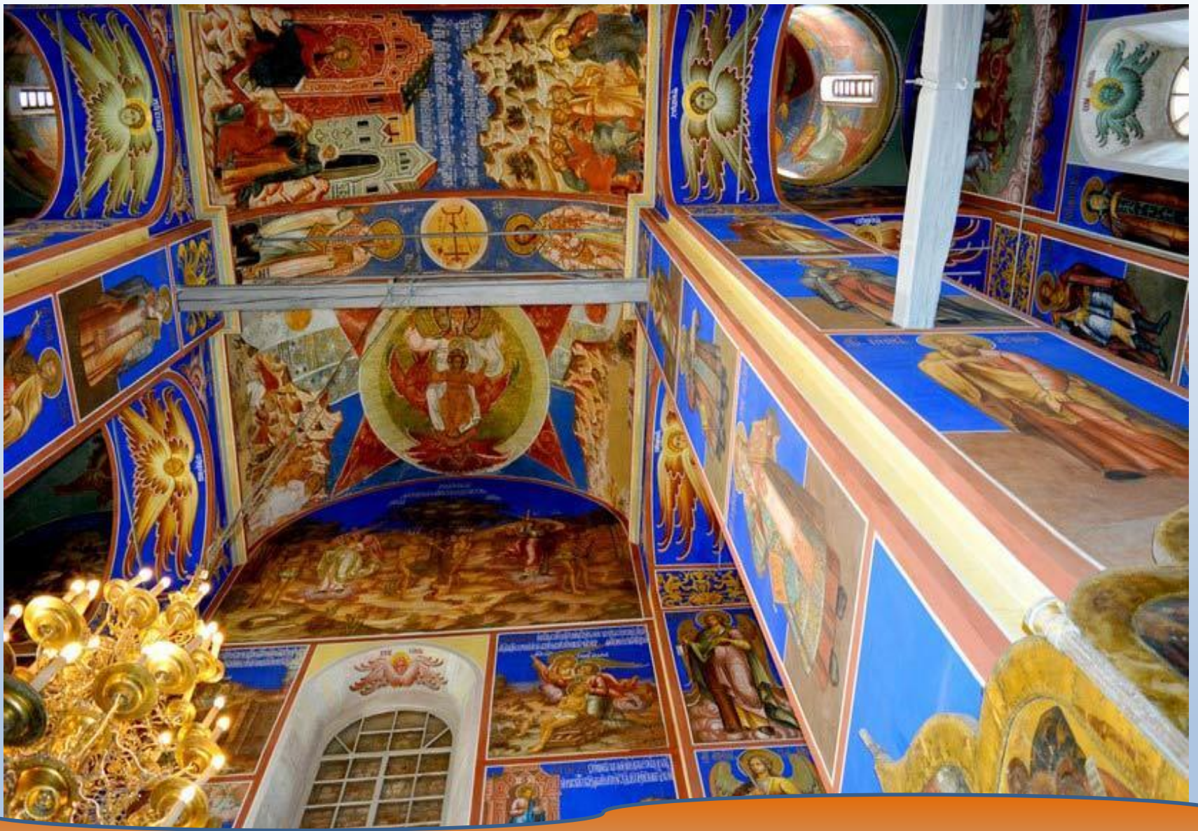
Фрагмент росписи в соборе Рождества Пресвятой Богородицы