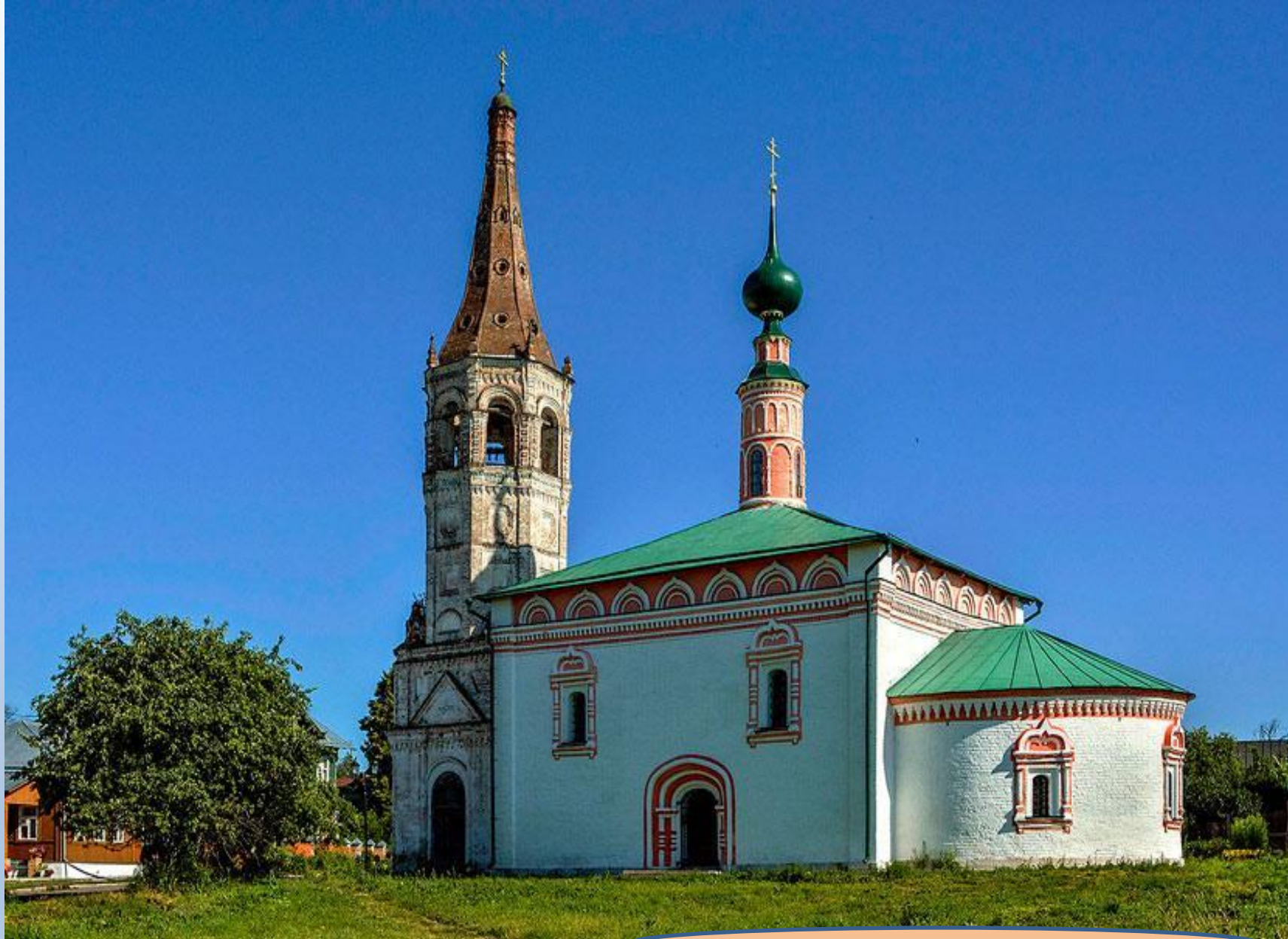
Летняя Никольская церковь