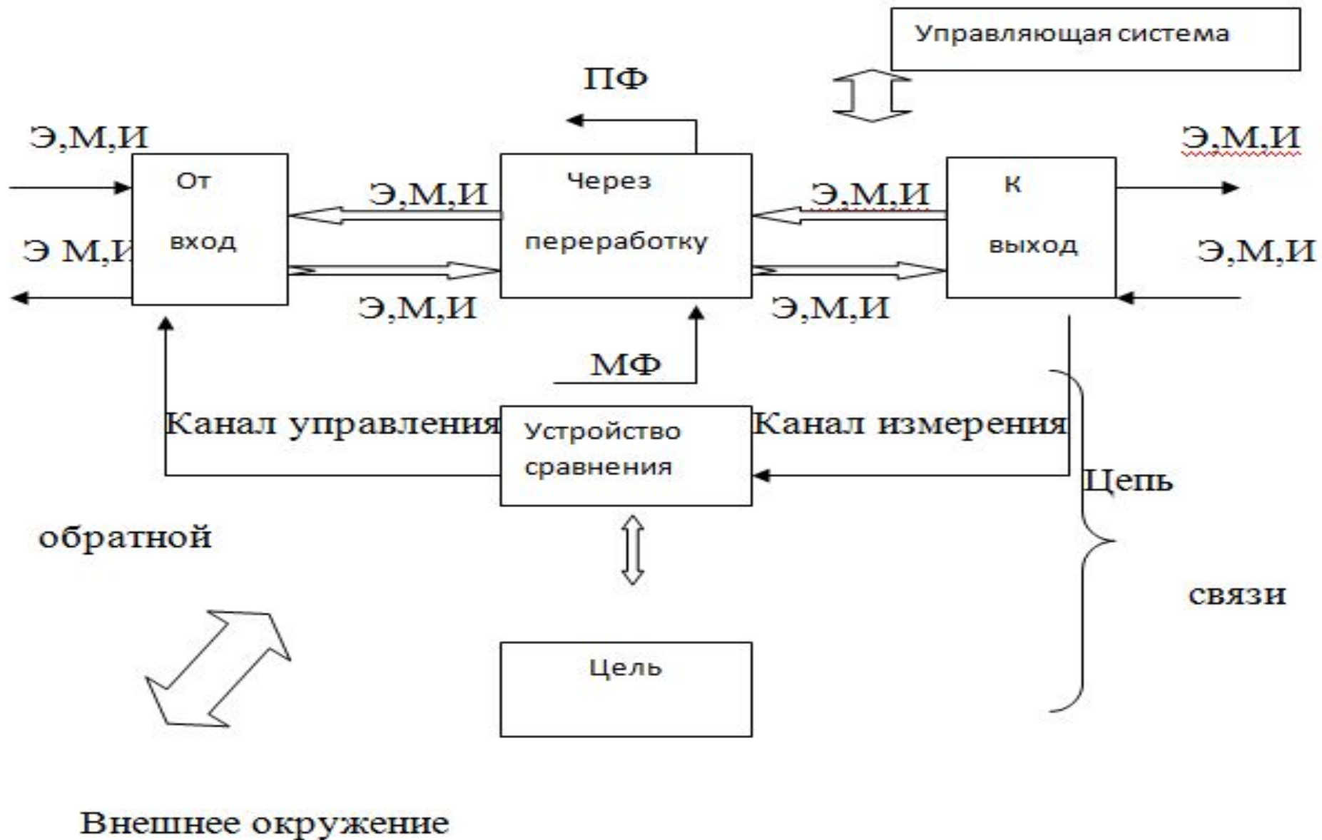
Рис. 2.1. Графическая информационно — кибернетическая модель процесса управления