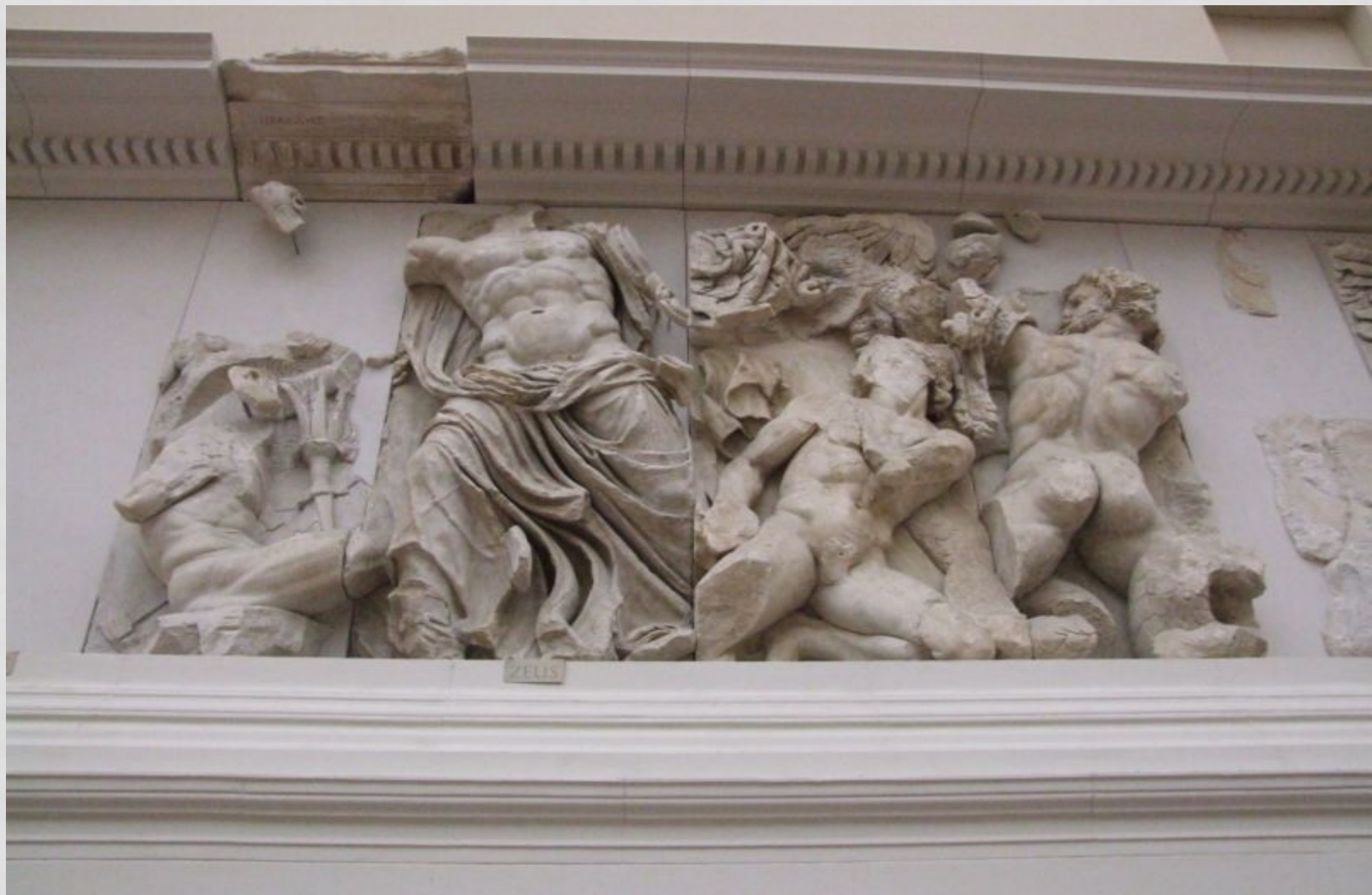
«Битва Зевса с Порфирионом»