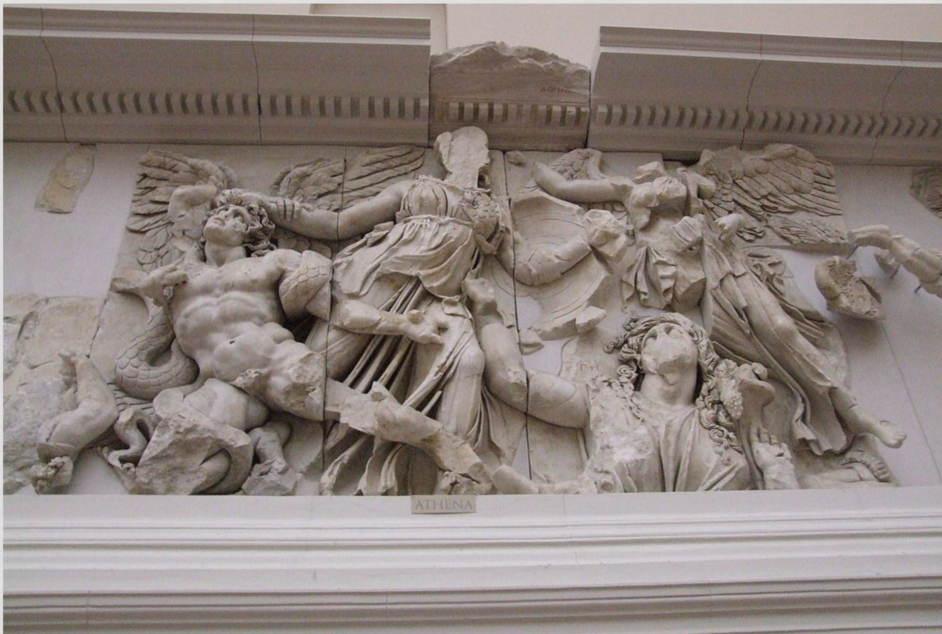
«Битва Афины с Алкионеем»