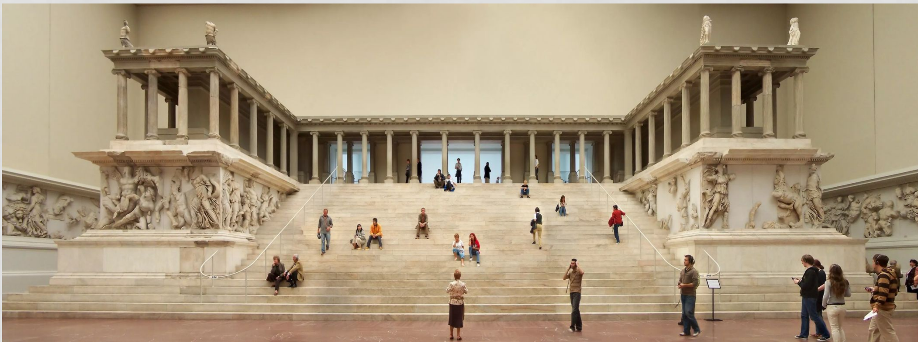
Общий вид западного фасада алтаря. Экспозиция в Пергамском музее