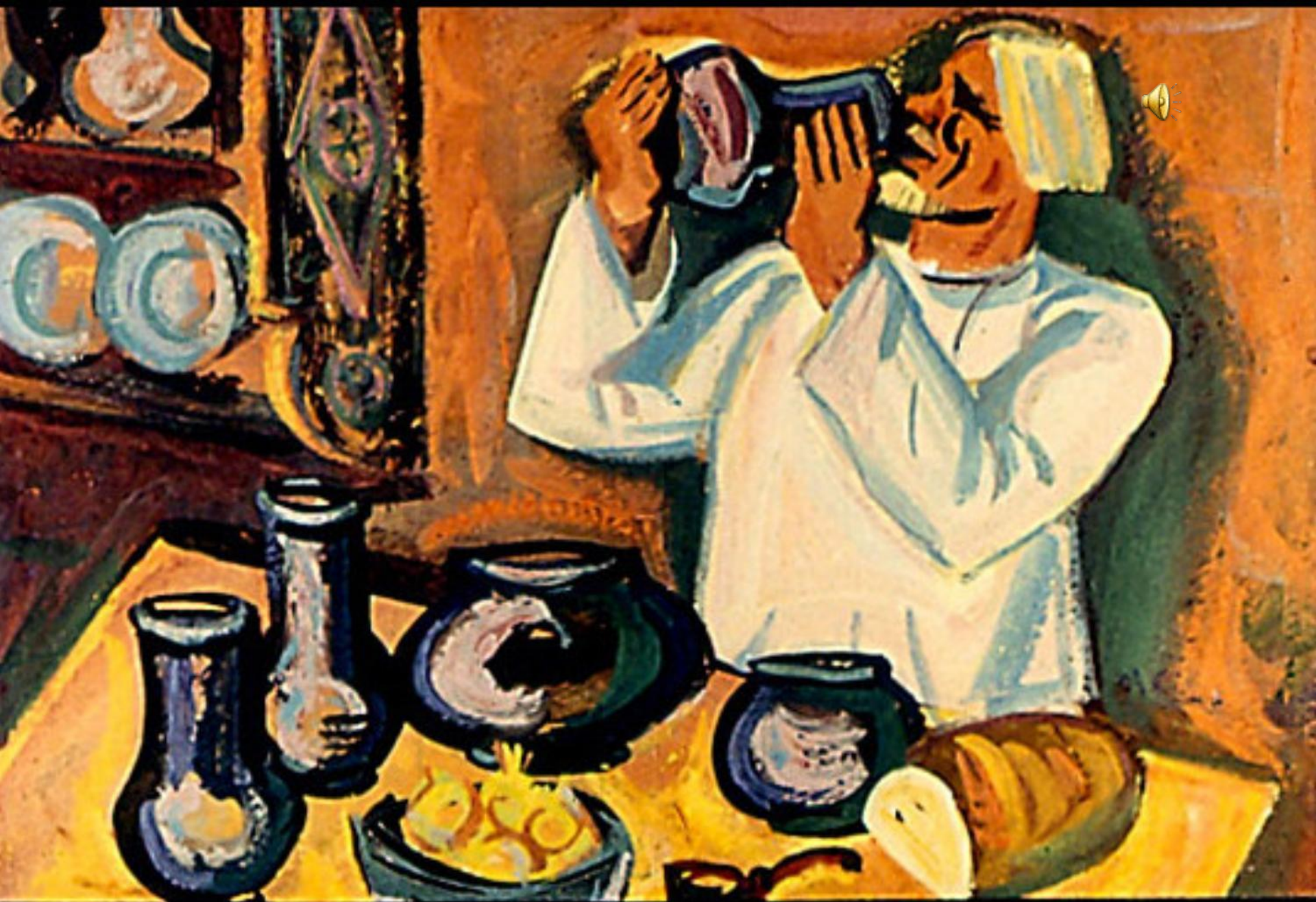
Ест за четверых,