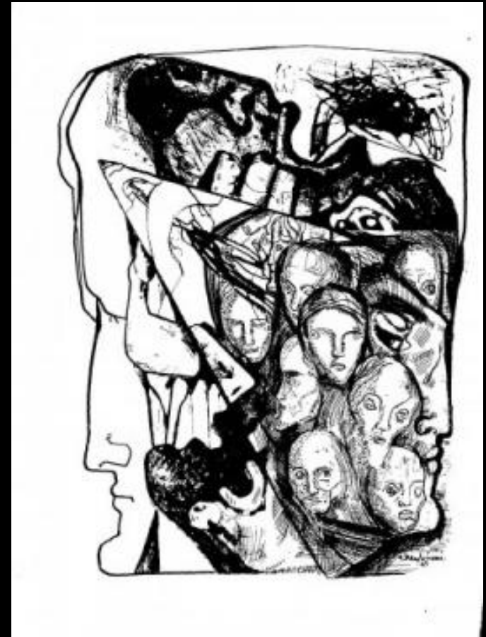
«Полифония» Э. Неизвестный

Отрицательные элементы его теории отражают «двойники» , а положительные – «антиподы».