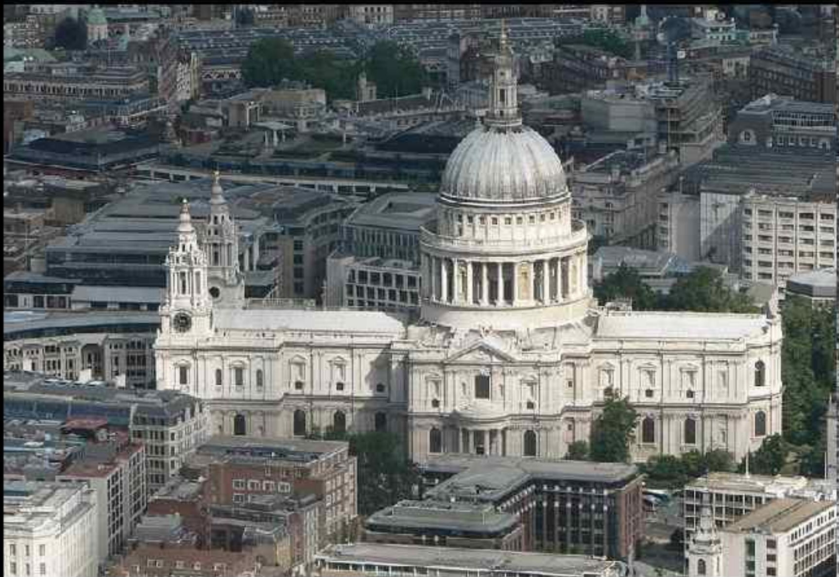
Кристофер Рен. Собор святого Павла, Лондон. 1675-1710