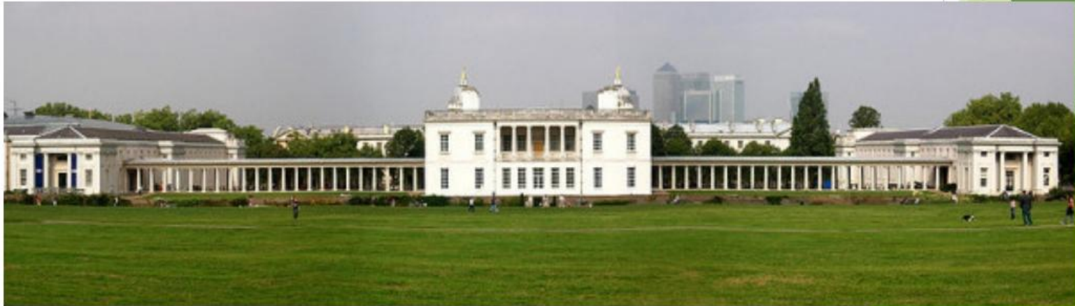
Куинс-Хаус в Гринвиче, Иниго Джонс

Английский архитектор Иниго Джонс, поклонник работ Андреа Палладио, в 17 веке перенес архитектурное наследие Палладио в Англию. Считается, что Джонс был одним из архитекторов, положившим начало английской архитектурной школы.