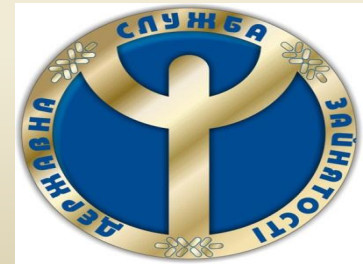
Государственная служба занятости Украины