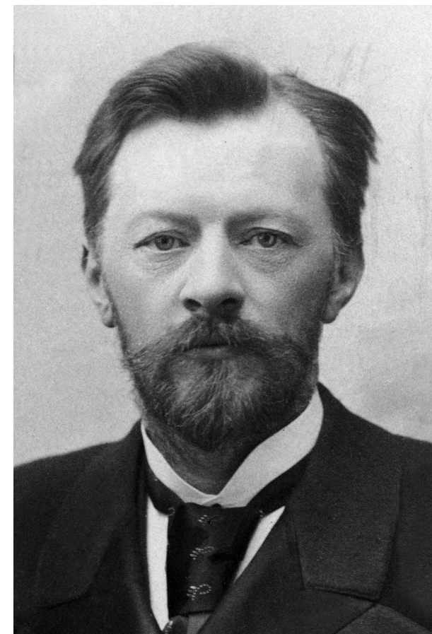
Владимир Григорьевич Шухов 1891г.